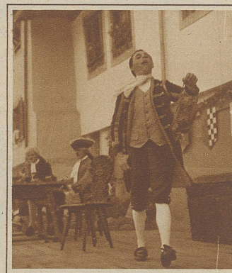
Der Schloßknecht aus dem Festspiel. Er hatte die Lacher auf seiner Seite und hat seine Sache ausgezeichnet gemacht