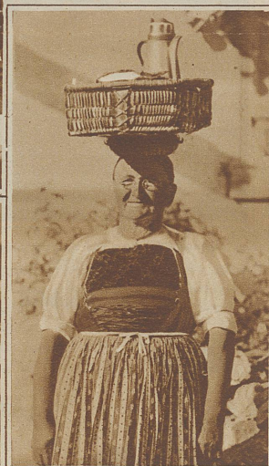
Nach alter Weise: geschickt, gesund, lustig und währschaft