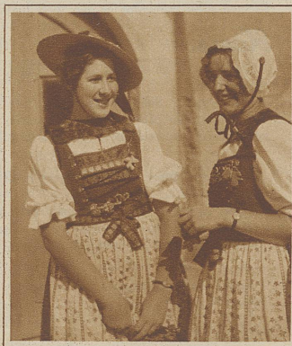
Badenerinnen. Motto: Die Wirklichkeit ist immer noch hübscher als die gelungenste Photographie

starb 67 Jahre alt. In seiner ersten Zeit hat er den Korn- hauskeller in Bern ausgemalt und sich seither vor allem als Illustrator und Heral- diker einen Namen gemacht. Die Berner Universität ver- lieh ihm ehrenhalber den Doktor der Philosophie