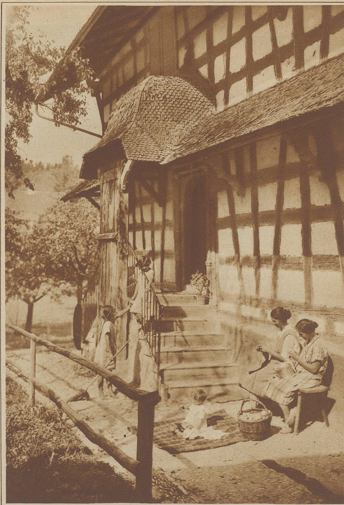
In der Herbstsonne. Vor einem alten Thurgauerhaus in Wigoltingen

«Es ist vorteilhaft, in einem solchen Haus zusammenzukommen,» sagte Mr. Farmer, «denn die leiseste Bewegung läßt das ganze Gebäude vom Keller bis zum Dach erzittern.»