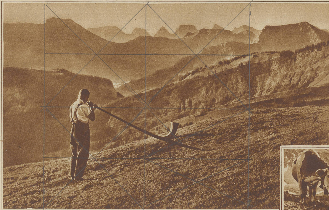
Alphornbläser. Im Hintergrund die Churfürsten