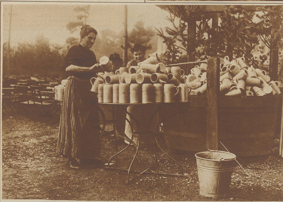
Morgenidyll auf der Festwiese: Maßkerngewäsche

laut röcheln möchte. Aber ich beiße die Zähne zusammen, daß kein Laut hervor kann und balle meine auf dem Rücken gefesselten Fäuste, daß unter den Nägeln das Blut hervorspritzt.