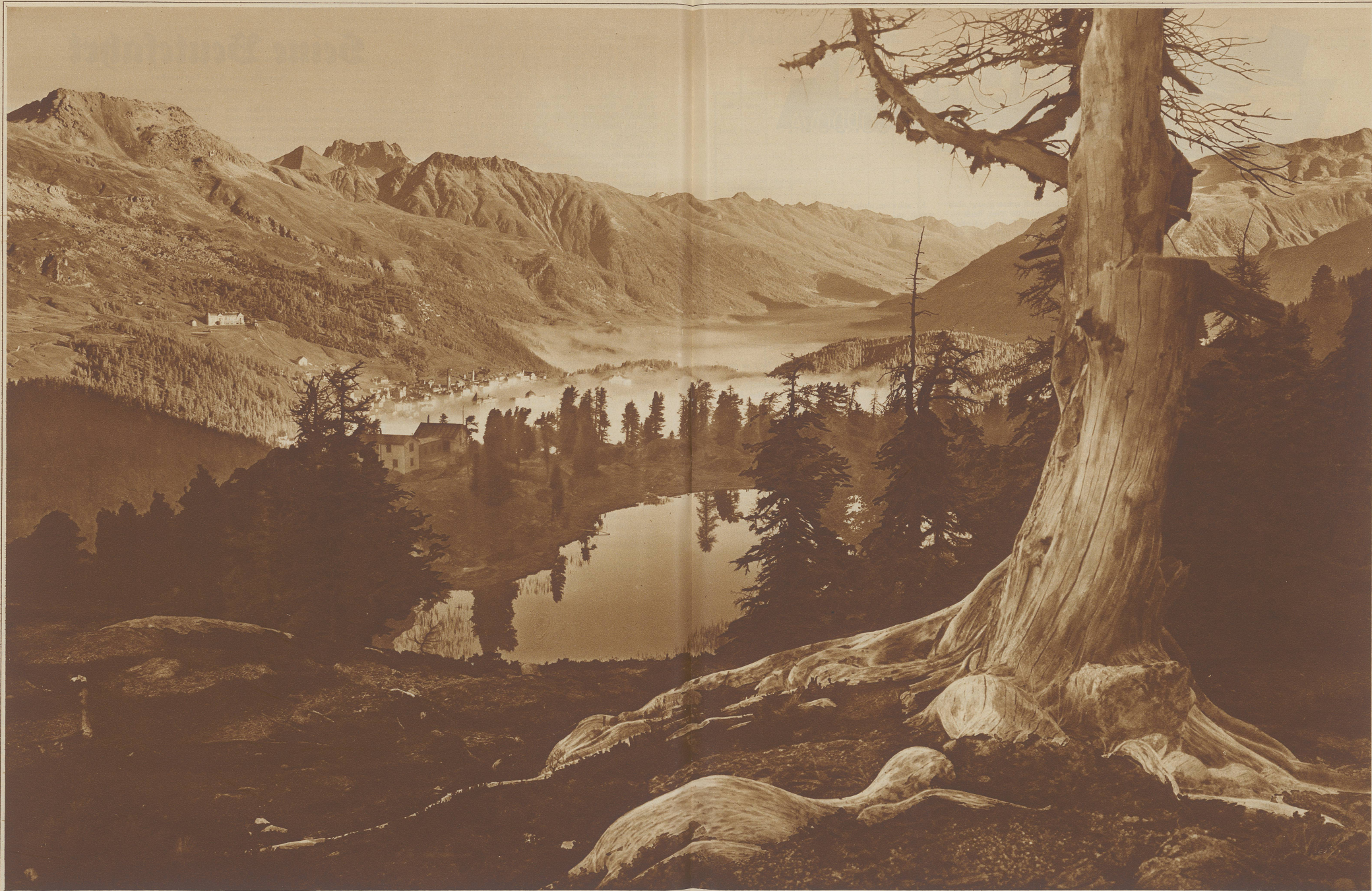
HERBSTSTIMMUNG ÜBER DEM ENGADIN * BLICK VOM HAHNENSEE AUF ST. MORITZ