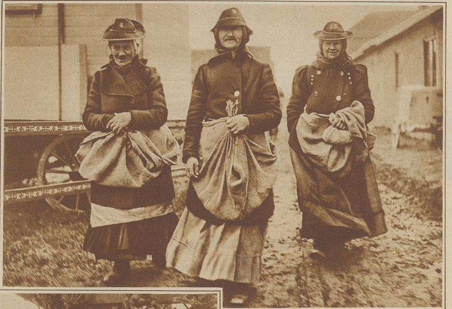
Die sogenannten «Papierweiber», die von der Stadt angestellt sind, um die Wiese von weggeworfenem Papier zu säubern

ser gesteckt und die Ohren voll davon hätte. Dunkel und verworren dringen die Geräusche der Außen-