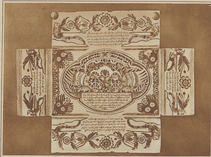
Liebesbrief aus Wetzikon in Form eines Scherenschnittes (Siehe Artikel)

Das Herz müssen sie damals in Wetzikon überhaupt stark strapaziert haben. Ein Konkurrenz-künstler, dessen Werk nun auch im Museum ruht, malt Trauben als Symbol der Zärtlichkeit, Hennen, die Fruchtbarkeit bedeuten und einen Hahn, der einen guten Tag einkräht und reimt dazu: «wan ihr mich liebt, vom hertzen fein, so soll mein hertz auch offen stehn, dann weil ich läb auf dieser erden, niemand als ihr so lieb sol werden...»