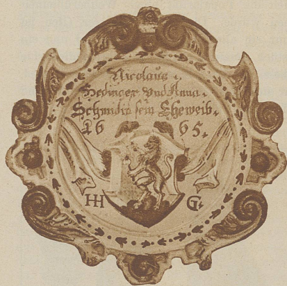
Sie haben sich gefunden. Das Schild über der Haustür in Wetzikon

Oder, um einen kühnen Sprung zu machen: von der Philosophie, der Weisheit, zu ihrem