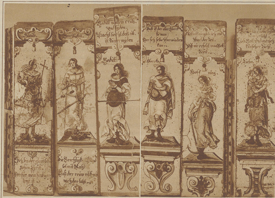
Darstellung der Kardinaltugenden (Glaube, Gerechtigkeit, Geduld, Stärke, Hoffnung, Liebe) auf prunkvollen Kacheln

Besonders bemerkenswert unter den Erzeugnissen Schweizer Volkskunst, die in Berlin aufbewahrt sind, erscheinen auch die Gegenstände des täglichen Gebrauchs. Da sind Milchkübel aus dem 18. Jahrhundert, kunstvoll geschnitzt und geschmückt, wie sie in unserer herzlosen und rationalisierten Epoche gewiß nicht mehr hergestellt werden. Oder der «Kleiekotzer», hinter welchem nicht gerade romantischen Namen ein kunstvolles Ornament sich verbirgt, das die Müller verwendeten. Durch den weit-aufgerissenen Mund rieselte die vermahlene Kleie herab. Jeder Kasten, jede Truhe, jedes Blatt ist ein wahres Kunstprodukt. Im Museum ist eine Stube aus all diesen Gegenständen zusammengestellt. Nicht einmal reichzisierte Nußknacker fehlen. Oder Arbeiten der Töpferei, wie sie einmal in Thun besonders gepflegt wurde. Oder eine Brautkrone von einem heute geradezu phantastisch anmutenden Reichtum. Das Kabinettsstück, wenn man so sagen kann, bildet die gekachelte symbolische Darstellung der Kardinaltugenden: Glaube, Gerechtigkeit, Geduld, Stärke, Hoffnung, Liebe. Die siebente, die Mäßigkeit, fehlt. Aber das soll — ausnahmsweise — gewiß kein Symbol sein.