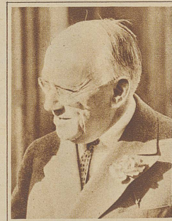
«Onkel Carl», der bekannte Filmmagnat Carl Laemmle, in Hollywood. Laemmle stammt aus Württemberg

Conrad Veidt erzählte mir: «Als ich in Hollywood ankam, fand am gleichen Abend gerade eine «Opening night» statt. Sie müssen unbedingt mit mir hin kommen, sagte John Barrymore zu mir und ließ mir keine Ruhe, bis ich zusagte. Aber am Abend war mein Gepäck noch nicht eingetroffen, und ich mußte mir einen Smoking leihen, dessen Hosen mir viel zu kurz waren. Nun stellen Sie sich vor, wie mir zumute war, als ich, todmüde und abgespannt, von der endlosen Reise mit Barrymore in meinen viel zu kurzen Hosen aus dem Auto stieg. Der Lautsprecher brüllte: Hier kommt John Barrymore mit dem deutschen Schauspieler Conrad «Wieth». Ein geradezu ohrenbetäubendes Pfeifen und Gröhlen der versammelten Volksmenge war die liebenswürdige Antwort. Wie konnte ich Neuling wissen, daß dies ein begeisterter Willkomm sein sollte? Ich nahm das Pfeifen und Johlen für eine feindselige Demonstration gegen den «deutschen Schauspieler Wieth» auf und lief, ja rannte in gestrecktem Galopp in meinen kurzen Hosen, um mich im Innern des Theaters in Sicherheit zu bringen.»