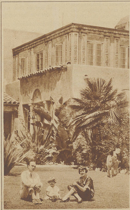
Conrad Veidt mit Familie im Garten seiner Villa in Beverly Hills bei Hollywood

(Aus dem demnächst erscheinenden Buch des Verfassers: «Hollywood, die Stadt der Illusionen».)