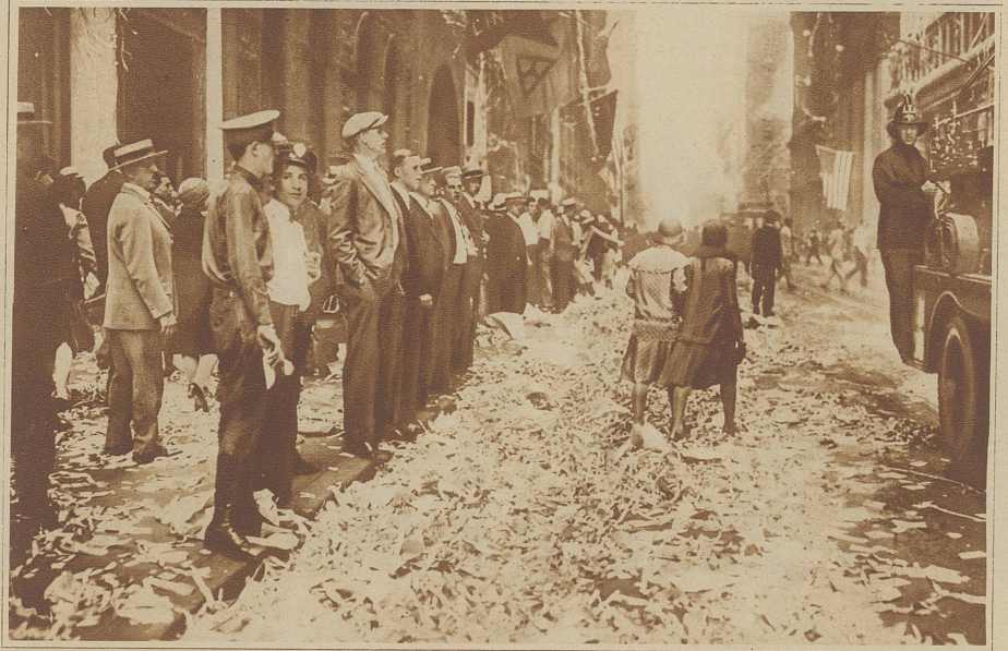
Wie's in den Straßen von New York aussah, nachdem Dr. Eckener, der Führer des Zeppelins, von den New-Yorkern begrüßt worden war