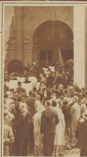
Einzug der Geistlichkeit zum Pontifikalamt in der Hofkirche