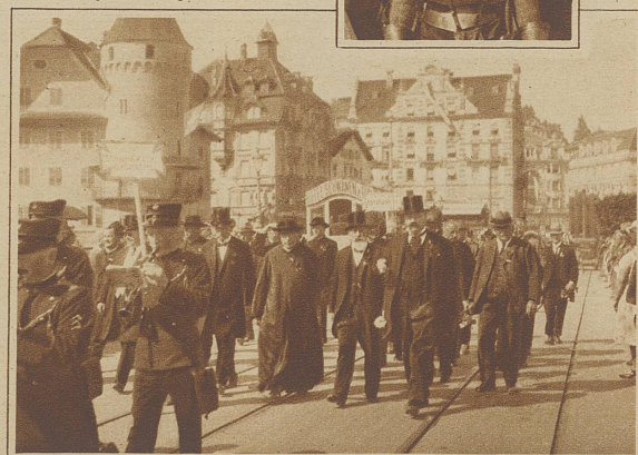
Das Zentralkomitee des Schweiz. kath. Volksvereins im Festzuge Links nebenstehend: Der Festzug auf der Seebrücke. Im Hintergrund die Festhalle, das frühere Kriegs- und Friedensmuseum