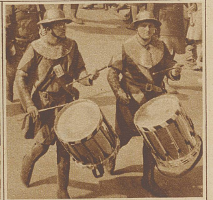
Trommler im Panzerhemd