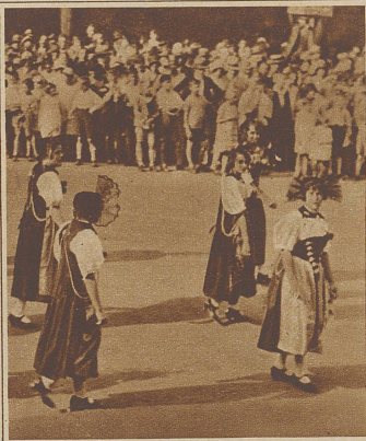
Berner Leist. Die Berner Meitschi nahmen sich zwischen all den Landsknechten und Kriegserinnerungen sehr herzerfreuend aus