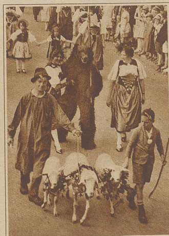
Der Bernerhirt. Dem Muten im Hintergrund ist schon unbeschreiblich heiß, seine hübsche Begleiterin macht ihm nun auch noch zu schaffen