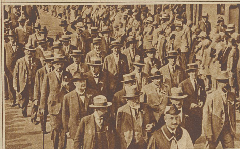
Die Basler Regierung im Festzug