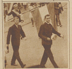
Die Studenten im Vollwuchs ziehen ihre Mützen vor dem St. Jakobsdenkmal