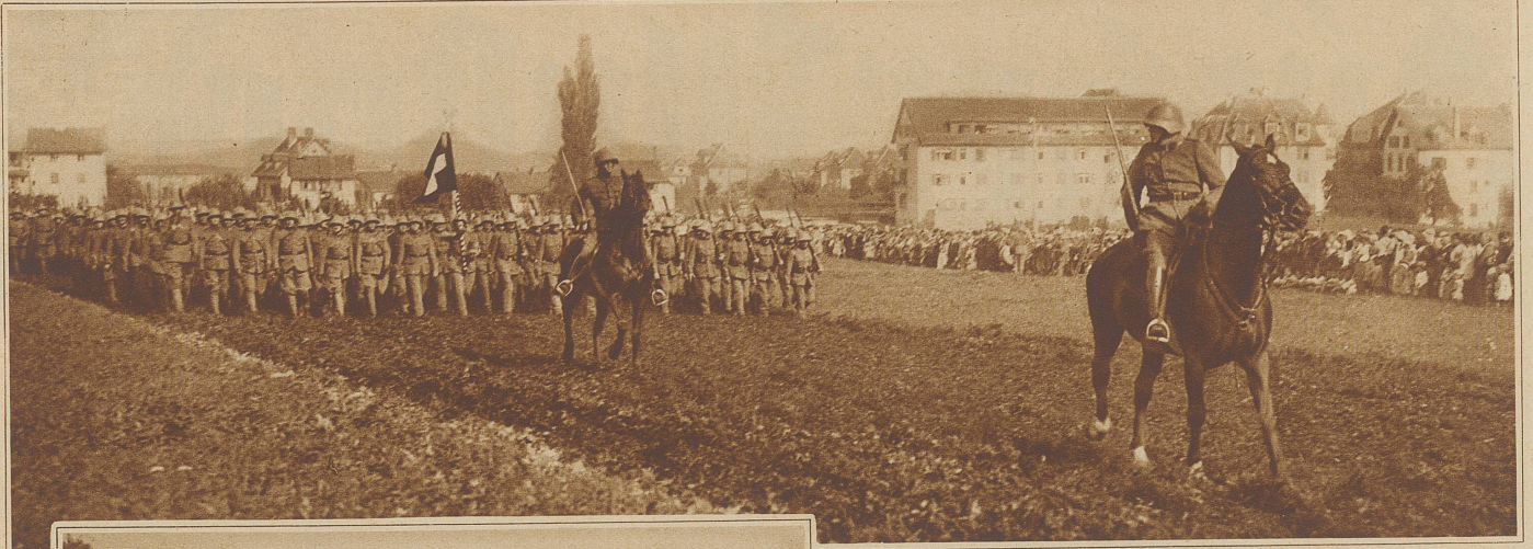
Defilee vor Oberstdivisionär Wille in Zürich