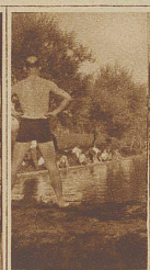
Der schöne Rücken