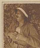
Der Schlaf des Gerechten