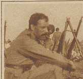
Was wohl Frau und Kinder machen?