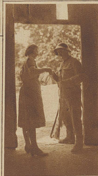
Warum der Meldeläufer so lang nicht mehr zurückkommt