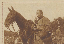
D'Ordonnanz mit em Herr Houptme sim Güggel