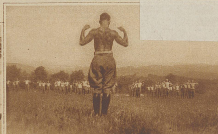
Krieg dem Speck