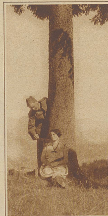
Wenn die Frau Landwehrmann auf Besuch kommt