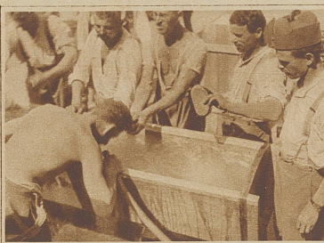
Nach getaner «Arbeit»