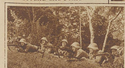
Ein Lmg.-Nest läßt sich photographieren