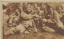
«Trink Brüderlein, trink . . .»