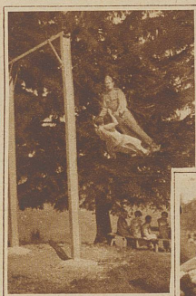
Zweierlei Tuch zieht immer noch