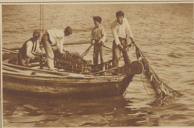
Sardellenfischer holen das Netz ein

auf; noch feiner und sorgfältiger müssen die aufgerollten Filets gemacht werden, in deren Mitte eine Olive gerollt wird, oder die in Oel