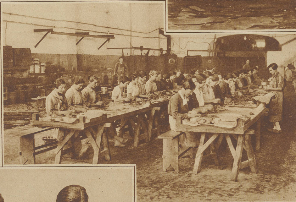
Bild rechts: Die «zarte Hand», die die schwierige Arbeit der Anchovisubereitung (die Sardellen werden auch so genannt) leisten muß