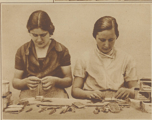
Arbeiterinnen bei der Herstellung der Konserven

wenn sich der Städter erst aus den Federn erhebt, kommen die Fischer, mit einer ganzen Anzahl von Booten im Schlepp, hereingeeilt; die wartenden Frauen lösen den empfindlichen Fang aus den Netzen, und in großen Körben wird er im Laufschrift — daß nur ja nicht zuviel Sonne ihm Verderben bringt — in die Fabrik geschafft. Hier werden die Fische gewaschen und dann in großen Fässern oder in Zementbottichen eingesalzen; mittags bereits ist die Arbeit beendet.