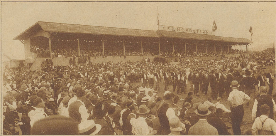
Einzug der Jodler und Schwinger auf dem Festplatz