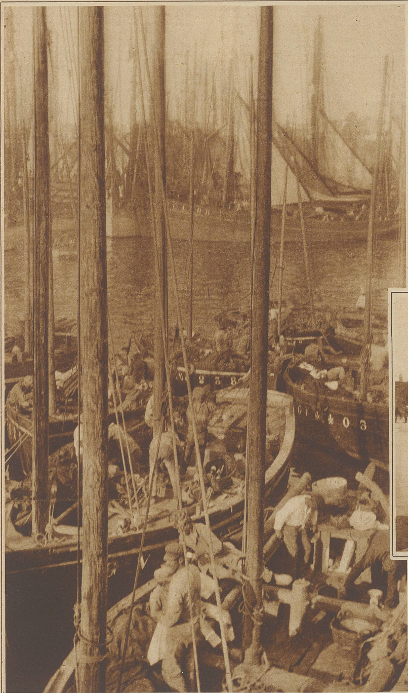
Ein malerisches Bild aus dem Hafen von Concarneau

rauen Aeußern sind es echte Frauen geblieben. Das zeigt sich vor allem auch abends, wenn die Fischer ihre Netze einziehen und sich todmüde in den heimatlichen Hafen treiben lassen. Dann eilen sie rasch zur Bucht hinab und winken den Heimkehrenden schon von weitem zu. Und manche reibt sich rasch mit dem Handrücken übers Gesicht, um vor den andern die Rührung zu verbergen, die sie beim Anblick dieser harten Arbeit ergriffen hat. A.B.