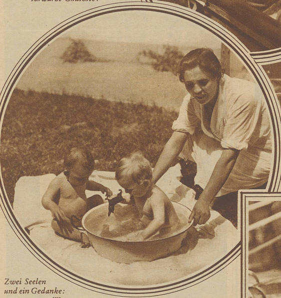
Zwei Seelen und ein Gedanke: Wasser

lein in diesem Haus ihren Einzug in die Welt gefeiert. Also: wenn auch kein Kindliteich, so doch eine rechte Kindli-Insel.