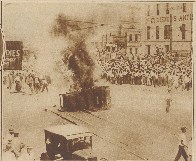
Blutige Ausschreitungen in New Orleans. In der an der Mündung des Mississippi gelegenen Stadt New Orleans ist ein Generalstreik der Transportarbeiter ausgebrochen, in dessen Verlauf es zu blutigen Kämpfen zwischen der Polizei und den Streikenden kam. Sechs Personen wurden getötet. Das Bild zeigt, wie Streikende ein Postauto umgeworfen und in Brand gesteckt haben

Sie fand in mehreren großen Kisten, die als diplomatisches Gepäck deklariert waren und persönliches Eigentum des gegenwärtig in Moskau weilenden afghanischen Gesandten Ghulam Nabi Khan enthalten sollten, etwa 250 kg Kokain. In die Schiebung mit diesem gefährlichen Rauschgift soll auch der in Paris studierende Sohn des Exkönigs Amanullah verwickelt sein. Neuere Feststellungen lassen in ihm sogar den Haupttäter vermuten