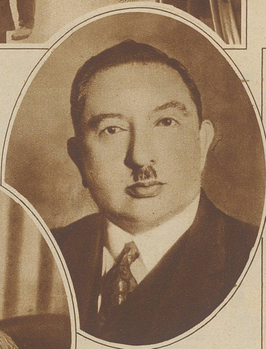
Der frühere afghanische Gesandte in Paris, der jetzt als Botschafter in Moskau lebt und wohl nicht zur Verantwortung gezogen werden kann

Die französische Polizei ist einem unglaublichen Skandal auf die Spur gekommen.