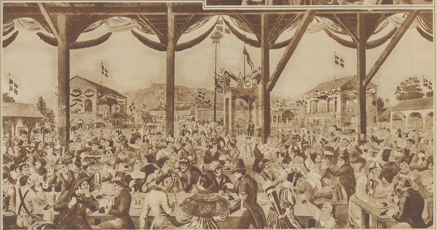
Ein Eids. Schützenfest vor 100 Jahren. Blick auf den Festplatz des Eids. Schützenfestes von Zürich im Jahre 1834