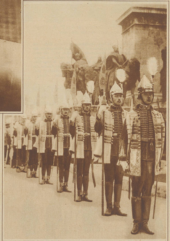
Die Leibgarde des ungarischen Reichsverwesers in ihrer prunkvollen Galauniform

Die amerikanische Theosophin Catherine Tingley ist dieser Tage auf der schwedischen Insel Visingö, ihrem Lieblingsort, im Alter von 77 Jahren an den Folgen eines Autounfalls, den sie zu Pfingsten erlitt, gestorben. Catherine Tingley war die Führerin einer Konkurrenzbewegung gegenüber der Theosophischen Gesellschaft, die von der 82jährigen Mrs. Annie Besant geleitet wird. Es ist eine merkwürdige Tatsache, daß beide großen theosophischen Schulen der Gegenwart von Frauen geleitet wurden, und daß beide Frauen sich als Nachfolgerinnen und Erbinen einer anderen Frau, der Schöpferin der Theosophie, Mrs. H. P. Blavatsky, ausgegeben haben