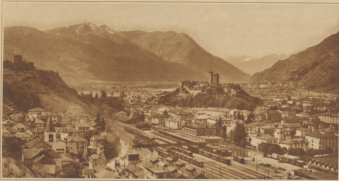
Blick auf Bellinzona mit den aus der Vögtezeit stammenden Kastellen