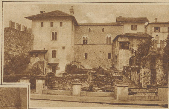
Das als Museum dienende Castello dei Visconti in Locarno

Jede Kirche und Kapelle beherbergt wertvolle Gemälde unbekannter Künstler, die ihr Können in naiver Freude an der Farbe hinzeichneten. Kein Ort, der nicht einen Christophoro, einen Georg oder eine Madonna hätte, darunter sogar eine Nachbildung des Abendmahls Leonardo da Vinci in Ponte Capriasca. Ueber allen glänzen die Fresken Luinis in Lugano und das Altarbild «Kreuzigung» in der Collegiata Bellinzona, Tintoretto zugeschrieben. Im Mendrisiotto das Museum Vincenzo Velo, ein Heiligtum genialer Bildhauerkunst. Locarno zeigt am Casa Borroni die künstlerisch wertvollste Hausfassade der ganzen Schweiz. Leider fällt sie langsam den Unbilden der Witterung zum Opfer.