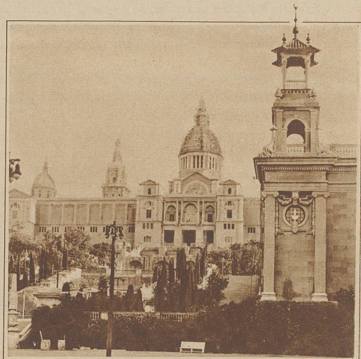
Garten und National-Palast

ALLE REISEBUROS ERTEILEN AUSKUNFT ÜBER GÜNSTIGE VERKEHRSVERBINDUNGEN UND FAHRPREISERMÄSSIGUNGEN FÜR DIE BESUCHER DER AUSSTELLUNG