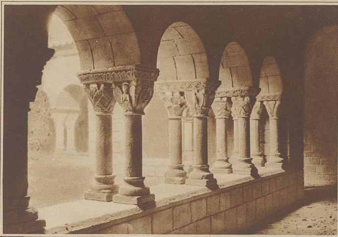
Kloster des S. Benet Bages