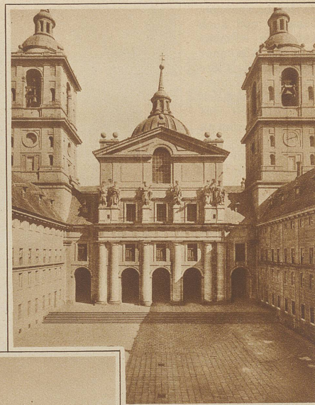
Der «Hof der Könige», so benannt nach den 6 Statuen alttestamentlich. Könige

am Tage der Auferstehung der Blick zuerst auf jenes Wesen falle, das man zu Lebzeiten am liebsten hatte». Von Philipp II. ist nur noch ein Häufchen Staub übrig geblieben. Sein Vater jedoch, Kaiser Karl V., ist als Mumie noch gut erhalten. † In der sich über mehrere Säle verteilende Prinzengruft sind Mitglieder der königlichen Familie beigesetzt, von dem durch Schiller unsterblich gewordenen Don Carlos an bis zu den Schwestern des regierenden Königs. Riesengroß ragt unter allen Don Juan de Austria empor, der Sieger der Seeschlacht von Lepanto, welche die Türkenfahrt von Westeuropa fernhielt. † Die Höfe, Gänge und Treppen atmen so sehr den Geist von Philipp II., daß man sich fürwahr nicht wundern würde, wenn