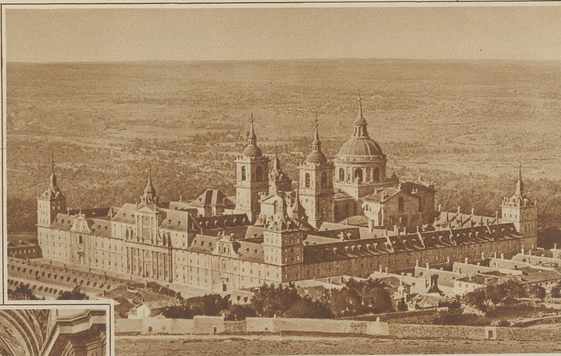
Der Eskorial vom «Stuhl Philipps II.» aus gesehen

er plötzlich dahergeschritten käme. Im Chor der mächtigen Kirche zeigt man noch seinen Stuhl, wo er bei kirchlichen Feierlichkeiten zu sitzen pflegte und wo er auch die Nachricht vom Sieg bei Lepanto erhielt. Dicht daneben ist die geheime Wandtüre, durch welche er unbemerkt eintreten konnte. † Bei Beisetzungen vollzieht sich der Ritus seit einigen Jahrzehnten der-