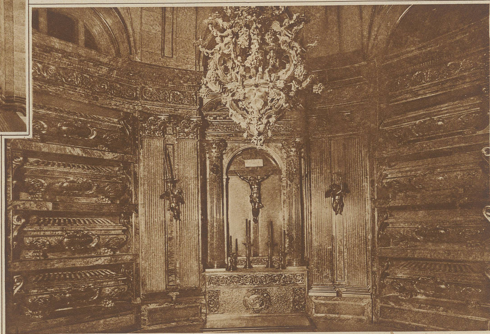
Bild rechts: Die Gruft der spanischen Könige im Eskorial. Links von oben nach unten: Kaiser Karl V., Philipp II., Philipp III. und Philipp IV.; rechts gegenüber die Gemahlinnen

Stunde Zwiesprache halten können und verlegte deshalb das einfache Schlaf- und Sterbezimmer dicht neben den Hochaltar, unter dem er nun in der Königsgruft beigesetzt ist. Sein Sarg ist der zweitoberste, links vom Altar. In sechs Reihen (drei links vom Altar, für die Herrscher, drei rechts, für die Herrscherinnen, die dem Kronprinzen das Leben gaben) sind je vier Marmorsärge übereinander angeordnet. Der Sohn ist immer unter dem Vater, die Gemahlin gegenüber dem Gemahl beigesetzt, damit