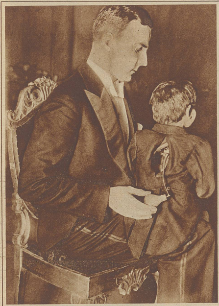
Das Bauchredner-Duo von der Rückseite

Links: Während der Vorführung. Der kleine Joseph (Puppe) ist verwöhnt und läßt sich vornehm von allen Seiten bedienen