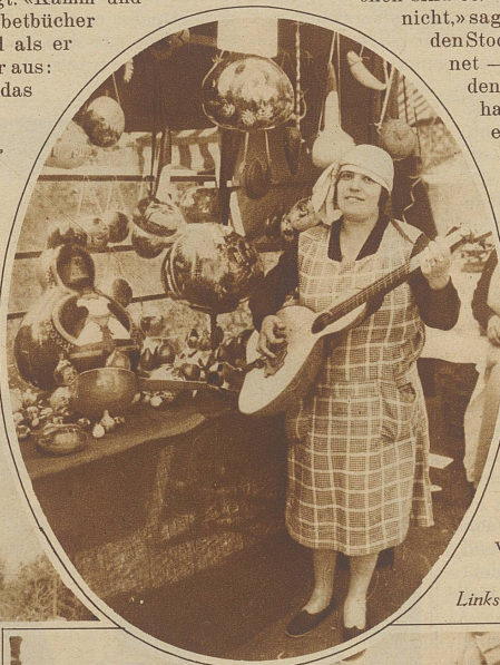
Links: Ein reich assortierter Stand

«Nein, das glaubst du nur so. Halt mir das ein wenig. Das andere Ende, du Schaf, sonst schneide ich dich. Nein!» rief er, als sie in ihrem Eifer, ihm zu helfen, sich ungeschickt anstellte, «hier, so — oh! macht nichts, es liegt nichts daran!» Seine Ungeduld und der Wunsch, es recht zu tun, hatten sie