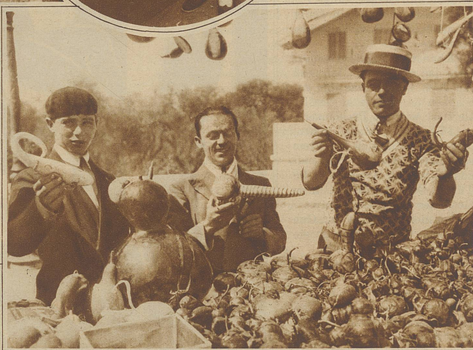
Buntbemalte Flaschen, Gefäße, originelle Figuren, alles aus Kürbissen

Hätte ihn Toby weniger geliebt, hätte sie vielleicht erwidert, daß es jetzt über ihn noch nichts zu wissen gab. Aber eines solchen Gedankens war sie nicht fähig.