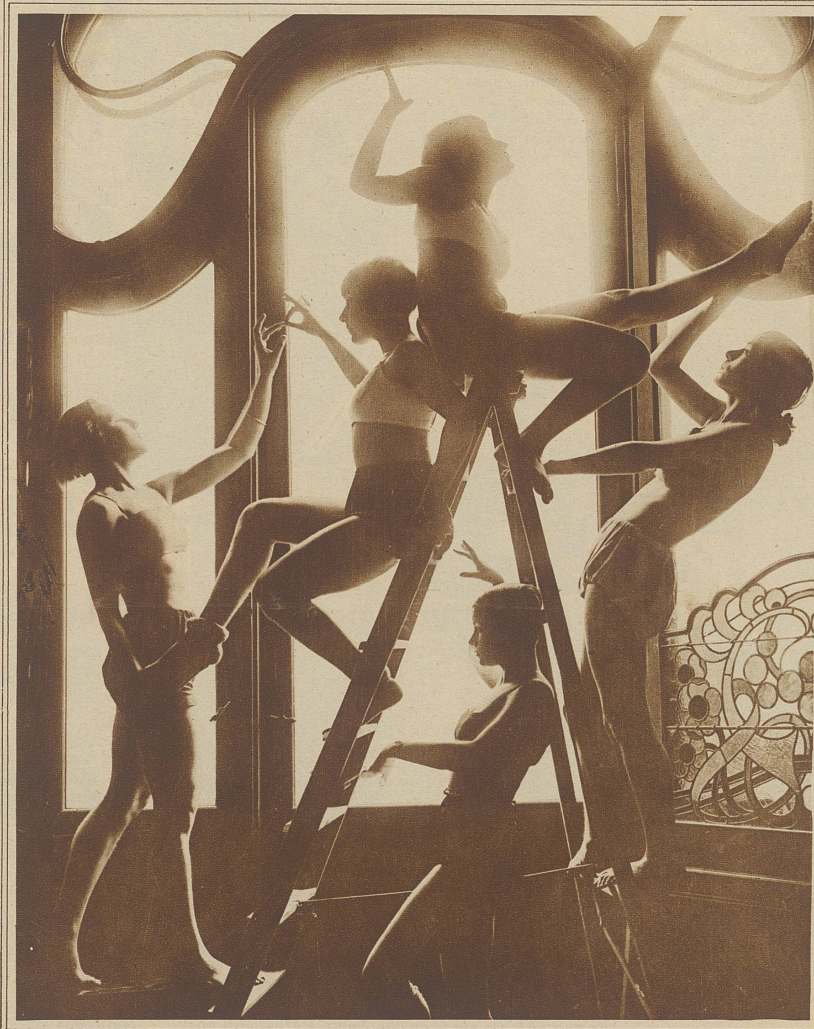
Tanzstudie der Schule Laban

das kleine Gehölz hastete, hörte er immer die Worte: Ich hasse dich — ich hasse dich!