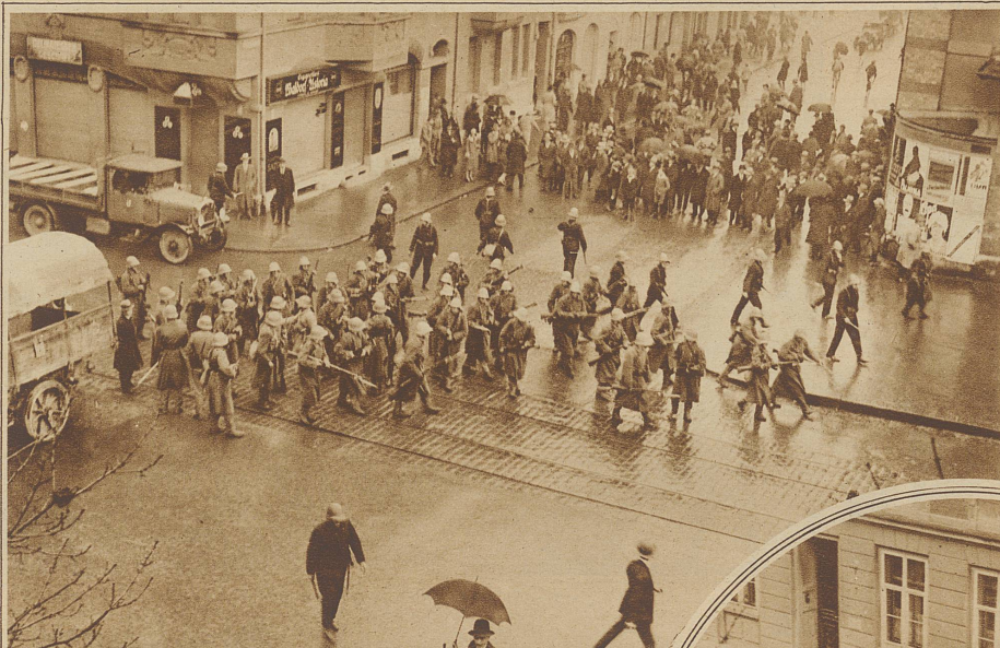
Die von den Ordnungstruppen unterstützte Polizei räumt den Platz vor dem Arbeiterheim an der Rebgasse