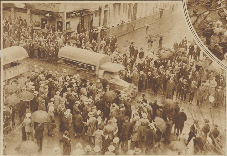
Auf Camions verladene Ordnungstruppen durchziehen die Hauptstraßen der Stadt