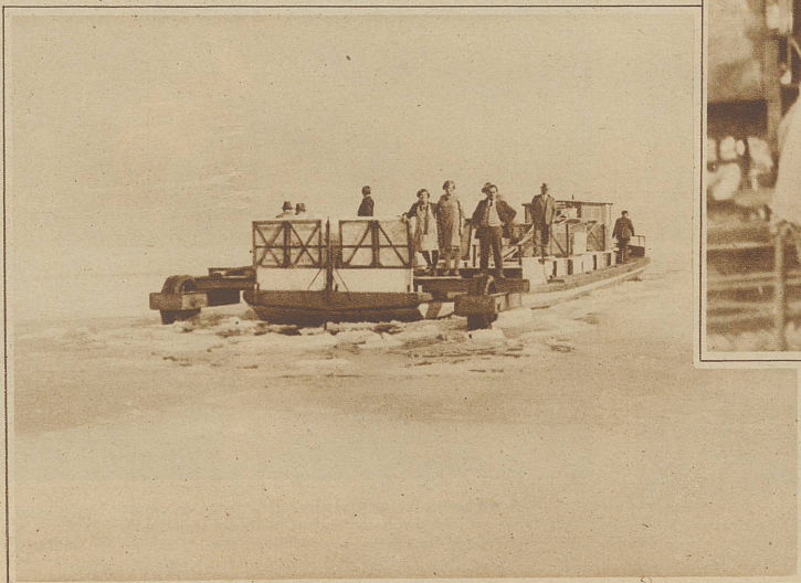
Bild links: Eisbrecher auf dem Zürichsee. Nicht nur die Dampfschiffgesellschaft, sondern auch die Ledschiffahrt hat durch die Seegefrörsse ganz bedeutenden Schaden erlitten. Von einem der Schiffbesitzer, der Firma Hunziker & Co., wurden deshalb Versuche unternommen, eine Fahrinne von Pfäffikon (Schwyz) nach Zürich zu brechen. Ein mit 150 Tonnen Backsteinen beladenes Ledschiff fuhr, vorn mit Gummirreifen eines alten Lastautos versehen, mit voller Geschwindigkeit auf das Eis und vermochte so jeweils die Decke auf eine Länge von 10 bis 20 Meter einzudrücken