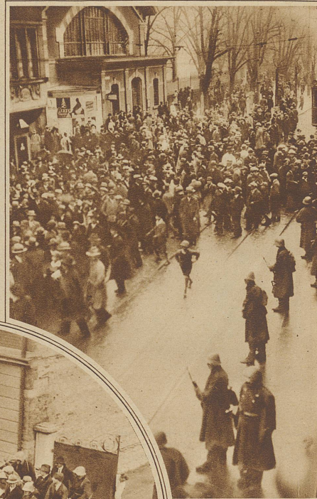
Beim Bläsitor, wo mehrere Kommunistenführer verhaftet wurden