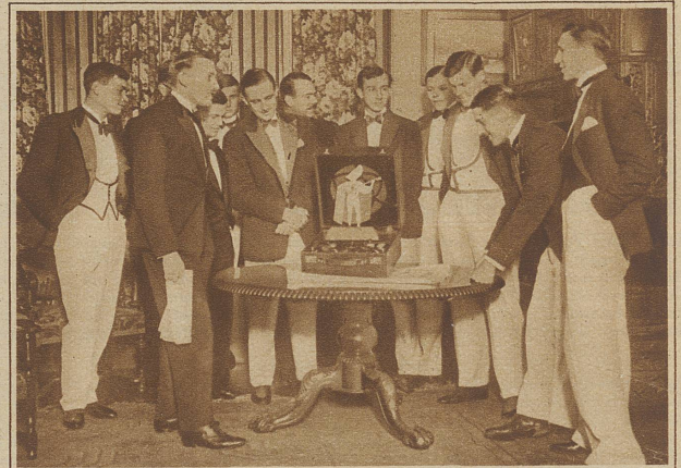
Die Oxforder Universitäts-Rudermannschaft kreiert eine neue Herrenmode. Bei gesellschaftlichen Anlässen tragen die Studenten weiße Flanellhosen, eine weiße, mit schwarzen Seidenborden eingefasste Weste und dazu den üblichen Smokingrock