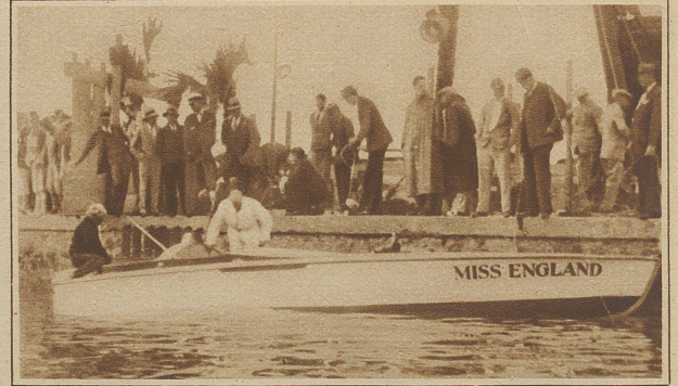
Mayor Segrave, dem es vorige Woche gelang, einen neuen Geschwindigkeitsrekord für Automobile aufzustellen, will nun auch den Motorbootrekord brechen. Schon die ersten Versuchsfahrten mit der «Miss England» gelangen vorzüglich, so daß man hofft, auf der Rennstrecke in Miami sensationelle Geschwindigkeiten erreichen zu können