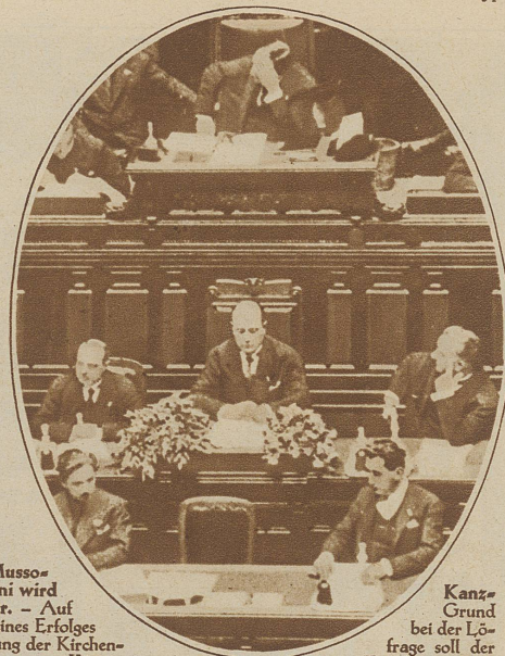
Mussolini wird ler. – Auf seines Erfolges Duce vom König zum werden. Damit würde auch seine vielseitige Ministertätigkeit gekrönt, die heute schon 8 Ressorts umfaßt, nämlich: Ministerpräsidium, Außen-, Kriegs-, Marine-, Luftfahrt-, Gewerkschafts-, Innen- und Kolonialministerium. Das Bild zeigt den Diktator bei seiner letzten Ressortrede im Parlament

Das Heben der Prunkschiffe Caligulas. Etwa 25 km südöstlich Roms liegt der Nemisee, aus dem die beiden Prachtschiffe des römischen Kaisers Caligula, der vom Jahre 37 n. Chr. bis zu seiner Ermordung im Jahre 41 regierte, gehoben werden sollen. Seit einem Jahr sind Pumpwerke im Betrieb (Bild), die den Seespiegel bis heute 4,80 Meter abgesenkt haben. Es fehlen nur noch 90 cm bis zum Heck des ersten der beiden Schiffe, so daß man hoffen darf, daß bis zum Herbst die hauptsächlichsten Partien freigelegt sind