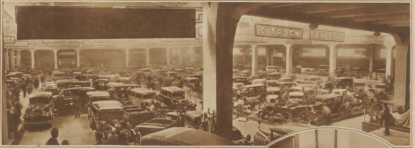
Blick in die große Ausstellungshalle