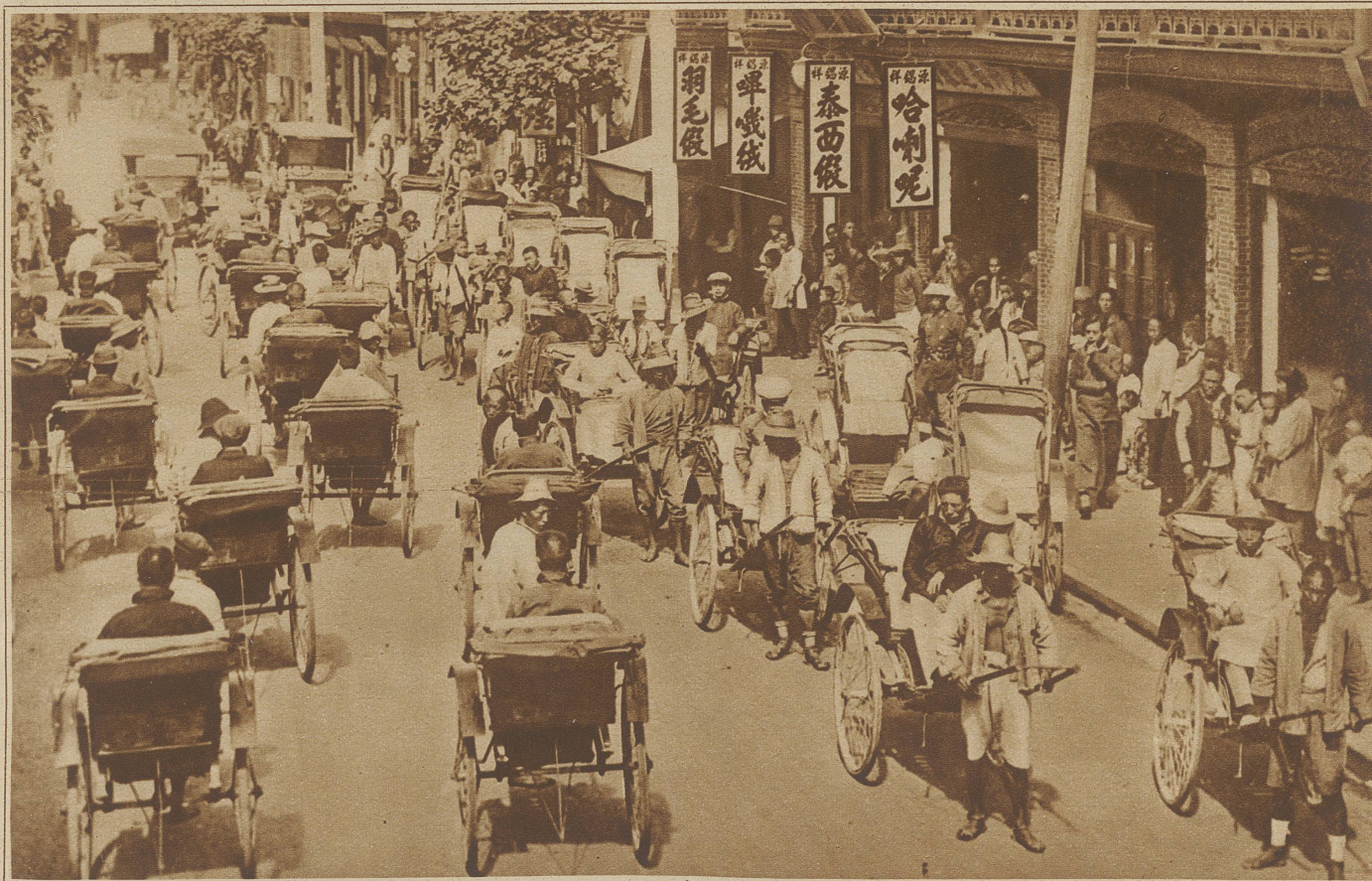
Riksha-Kulis. Trotz der energischen Vorstellungen, die von europäischer Seite zur Abschaffung der Rikshas unternommen wurden, bildet dieses Gefährt auch heute noch das Hauptverkehrsmittel der chinesischen Städte. Stundenlang traben die Kulis mit den Zweiräderkarren «Gass' auf Gass'» ab, bis der «Herr» gütigst aussteigen geruht und ihnen während seines Aufenthaltes im Teehaus oder Bazar einige Minuten der verdienten Ruhe gönnt. Wie lange mag es noch dauern, bis das Automobil als modernes Verkehrsmittel dieses, die Menschheit entwürdigende Bild, aus den Gassen verdrängt