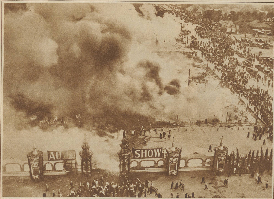
Brand einer Automobil-Ausstellung. In der nationalen Automobil-Ausstellung in Los Angeles brach eine gewaltige Feuersbrunst aus, der mehr als 300 neue, meist hochwertige Automobile und eine Anzahl Flugzeuge zum Opfer fielen. Der Schaden wird auf 10 Millionen Dollar geschätzt. Die 2500 Besucher, die sich im Moment des Brandausbruches in der Ausstellung befanden, stürmten in wilder Panik ins Freie. Verursacht wurde die Feuersbrunst durch einen Flugzeugmotor, der während einer Demonstration in der Halle in Brand geriet