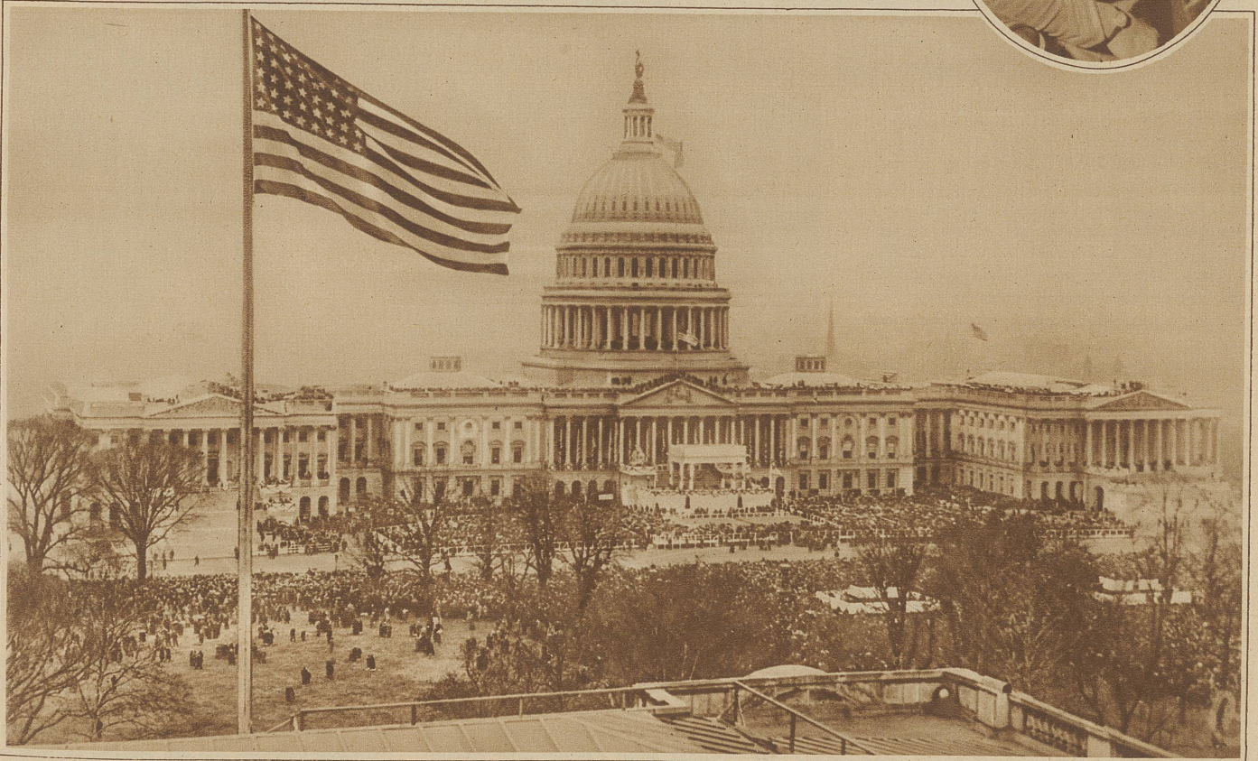
Präsident Herbert Hoovers Amtsantritt in Washington. Blick auf das festlich geschmückte Capitol während der Feier der Amtsübergabe