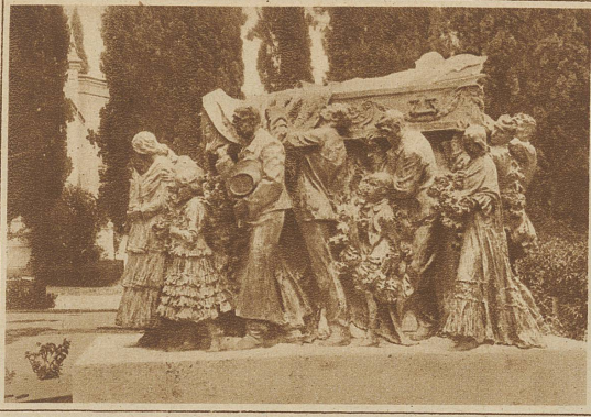
Wie Spanien seine Stierkämpfer ehrt. Dem berühmten spanischen Toreador Joselito El Gayo, der bei einem Stierkampf den Tod fand, ist in Sevilla dieses prächtige Denkmal errichtet worden