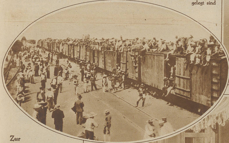
Zur Revolution in Mexiko. Wie die Regierungstruppen auf den Kampfplatz geführt werden