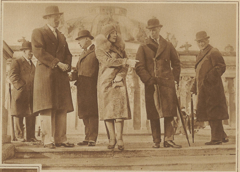
Der Herzog von York in Berlin. Der zweite Sohn des Königs von England hat mit seiner Gemahlin auf der Durchreise nach Oslo, wo er bei der Hochzeit des Kronprinzen Olaf als Trauzeuge fungiert, seit dem Kriege als erstes Mitglied der englischen Königsfamilie Deutschland einen Besuch abgestattet. Das Bild zeigt das Herzogspaar vor dem Schloß Sans Souci in Potsdam bei Berlin