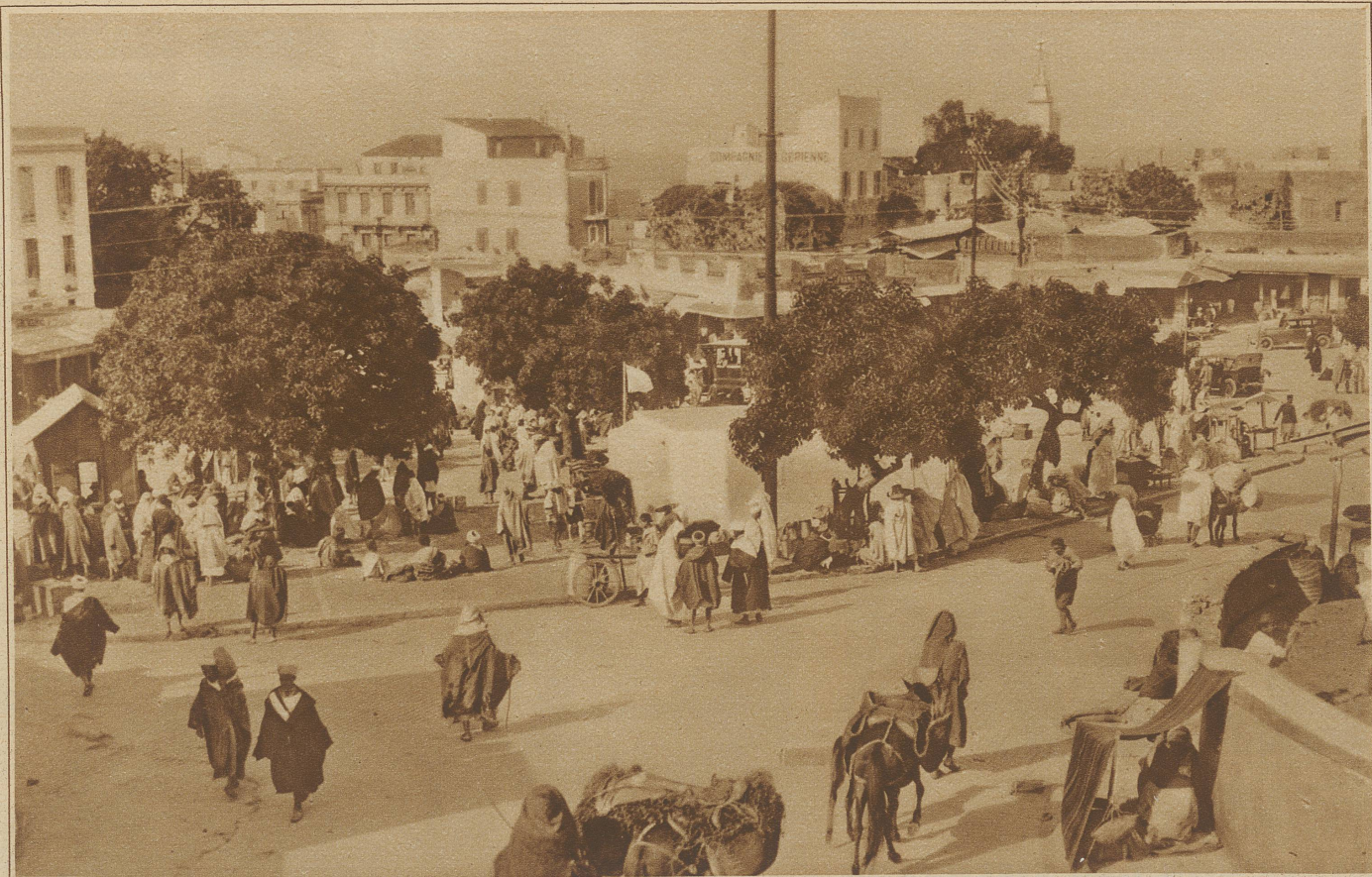
Straßenbild aus Tanger , der internationalen Stadt in Marokko. Den ganzen Tag, ausgenommen die heißesten Mittagsstunden, hocken und stehen die Eingeborenen auf den Straßen herum und warten, daß es Abend werde. Am andern Morgen beginnt das «Tagewerk» aufs neue