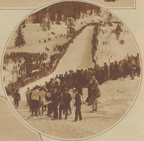
Blick auf die Sprungschanze während des Springens