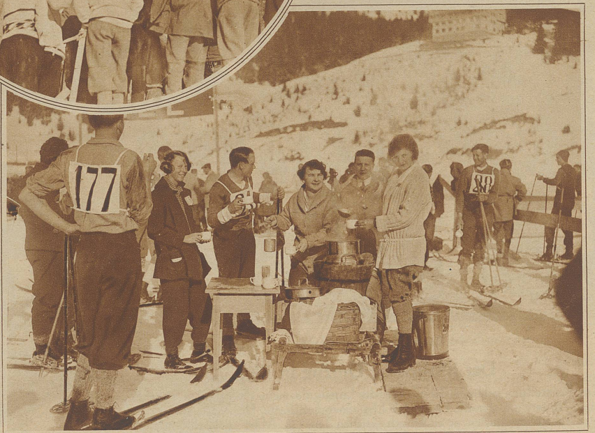
Eine Tasse Tee erlöst die Läufer nach glücklich vollendetem Rennen