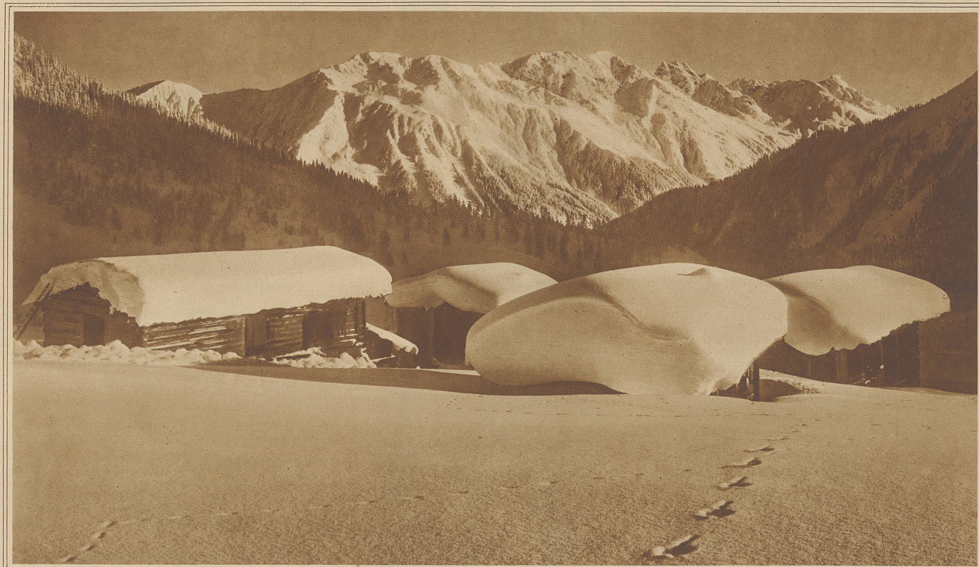
Wintermorgen bei Davos-Wolfgang