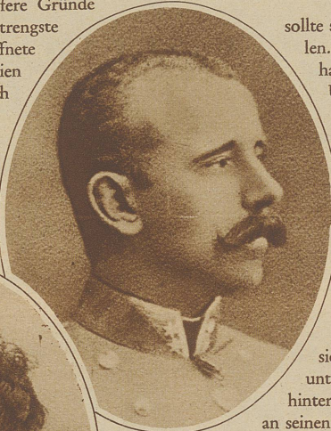
Kronprinz Rudolf von Oesterreich

der Frauen» aus. Die erste authentische Darstellung über den Tod wird nun in dem