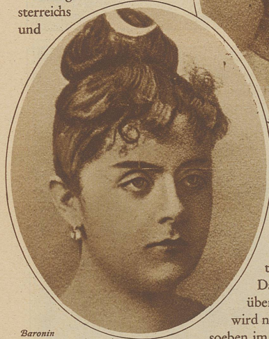
Baronin Maria Vetsera

Der tragische Untergang hat die Gestalt des Kronprinzen Rudolf von Oesterreich in eine Wolke von Legenden und Klatsch eingehüllt. Sein Selbstmord, gemeinsam mit der bildschönen Mary von Vetsera, dessen tiefere Gründe und nähere Umstände auf das strengste geheimgehalten wurden, öffnete den ausschweifendsten Phantasien Tür und Tor, und bald hatte sich der Kolportage-Roman dieses dankbaren Stoffes bemächtigt und stattete die «Tragödie auf Jagdschloß Mayerling» mit den abenteuerlichsten Erfindungen über den «Liebling Oesterreichs und