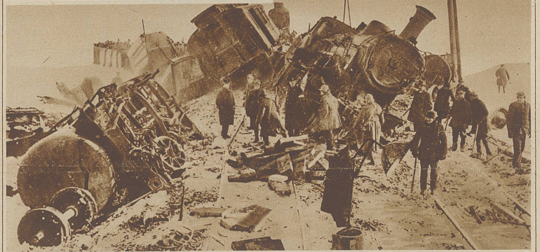
Bild rechts: Bei Lysa a. Elbe (Tschechoslowakei) fuhr ein Personenzug in einen Postzug hinein, wobei ebenfalls 4 Personen getötet und 15 schwer verletzt wurden.

Infolge schweren Nebels überfuhr bei Ashchurch (England) der Expresszug nach Tewkesbury die Signale und entgleiste bei voller Geschwindigkeit. Aus dem haushohen Trümmerhaufen wurden 4 Tote und 25 Verletzte geborgen.