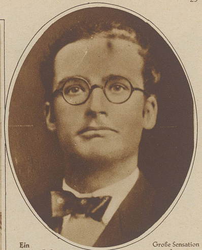
Ein weißer Rabe.