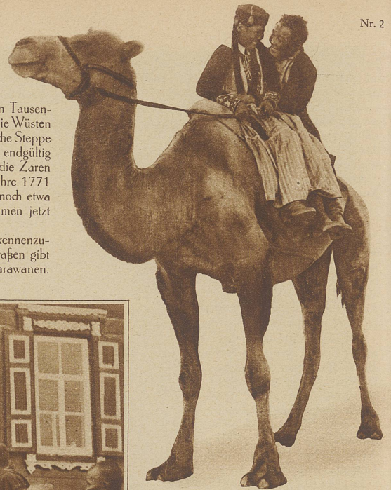
Die Liebe hört nimmer auf . . . , auch nicht in den eintönigen Steppen der Kalmücken; nur die Formen sind verschieden

Uns reizte es, dieses Kalmückenreich näher kennenzulernen, das selten eines Reisenden Fuß betritt. Straßen gibt es hier nicht. Nur die uralten Pfade der Kamelkarawanen.