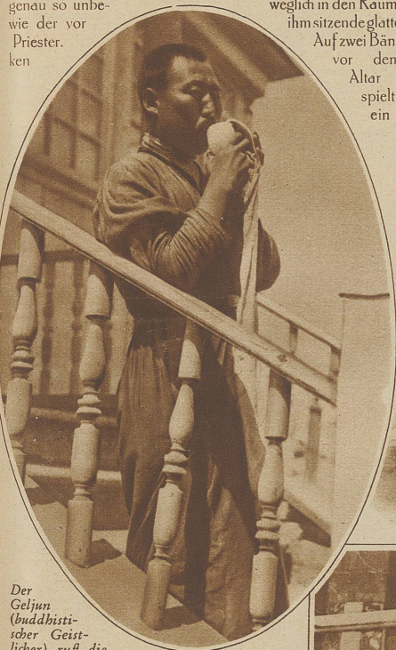
Der Geljun (buddhistischer Geistlicher) ruft die Gläubigen in den Churul zusammen

in herrlich gestickte seidene Gewänder gekleidet ist, blickt genau so unbewie der vor Priester. ken