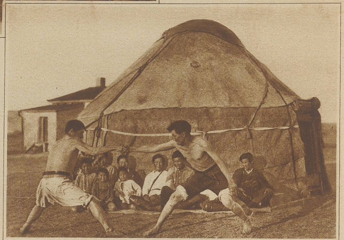
Ringkämpfe sind seit altersher ein guter Zeitvertreib bei den mittelasiatischen Völkern

Die Leiterin eines "Roten Zeltes", dieser typischen Propaganda-Einrichtung der Sowjetunion, ladet zum Betreten ein