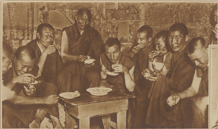
Die Schüler einer buddhistischen Priesterschule beim frugalen Mittagmal

in herrlich gestickte seidene Gewänder gekleidet ist, blickt genau so unbewie der vor Priester. ken