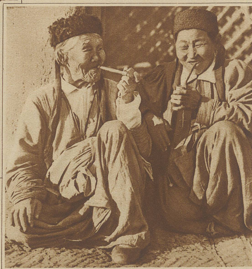
Zwei alte Kalmückinnen, denen das Rauchen eine Selbstverständlichkeit ist, sitzen vor ihrer Kibitka in der Abendsonne und rauchen vergnügt ihr Pfeifchen

Kindergärten. Während die Erwachsenen auf dem Felde arbeiten, werden hier die Kleinen tagsüber betreut. Ich suchte mehrere solcher Heime auf und konnte mich kaum von dem Anblick dieser lebhaften Menschenkinder trennen. Fast alle Kinder haben den kugelrunden Kalmückenschädel und blicken daraus mit beweglichen schwarzen, lustigen Augen in die Welt. Die Wachsamkeit der Steppenbewohner spricht aus ihnen. Nichts entgeht ihrer Aufmerksamkeit. Noch nirgends sah ich