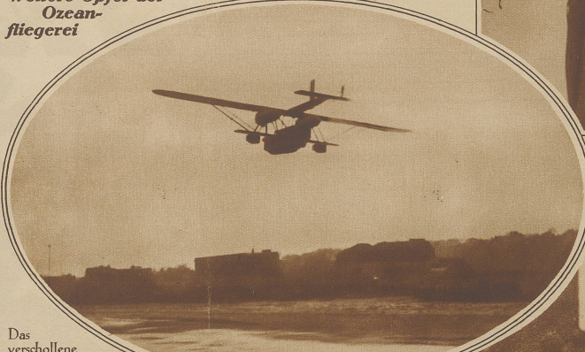
Das verschollene Flugzeug «Dawn» über Old Orchard