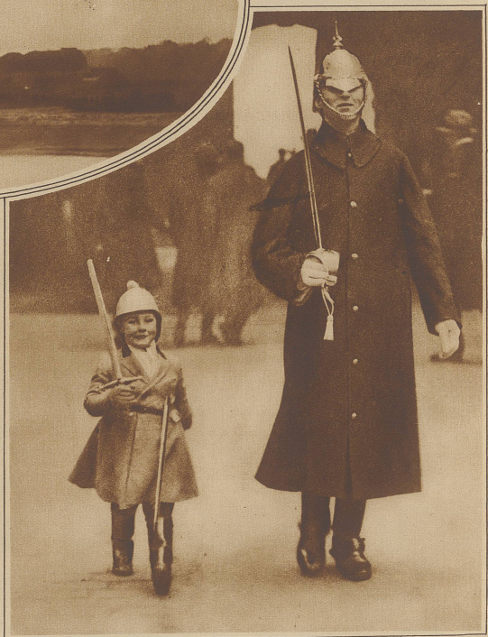
Aus der Londoner Weihnachtsparade. Ein großer und ein kleiner Leibgardist