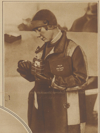
Frau Grayson vor dem Start in New York