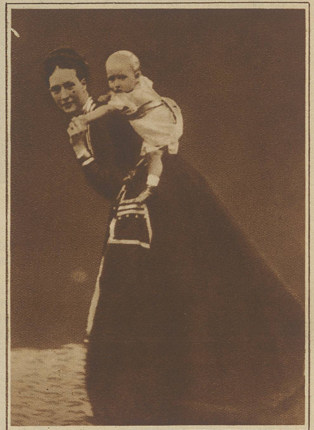
König Georg V. von England vor 62 Jahren als einjähriges Baby auf dem Rücken seiner Mutter, der Königin Alexandra