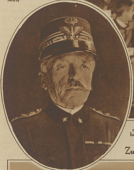
Links im Oval: Marschall Cadorna, bis zu seiner Niederlage von Caporetto Oberbefehlshaber der italienischen Armee, ist in Bordighera gestorben