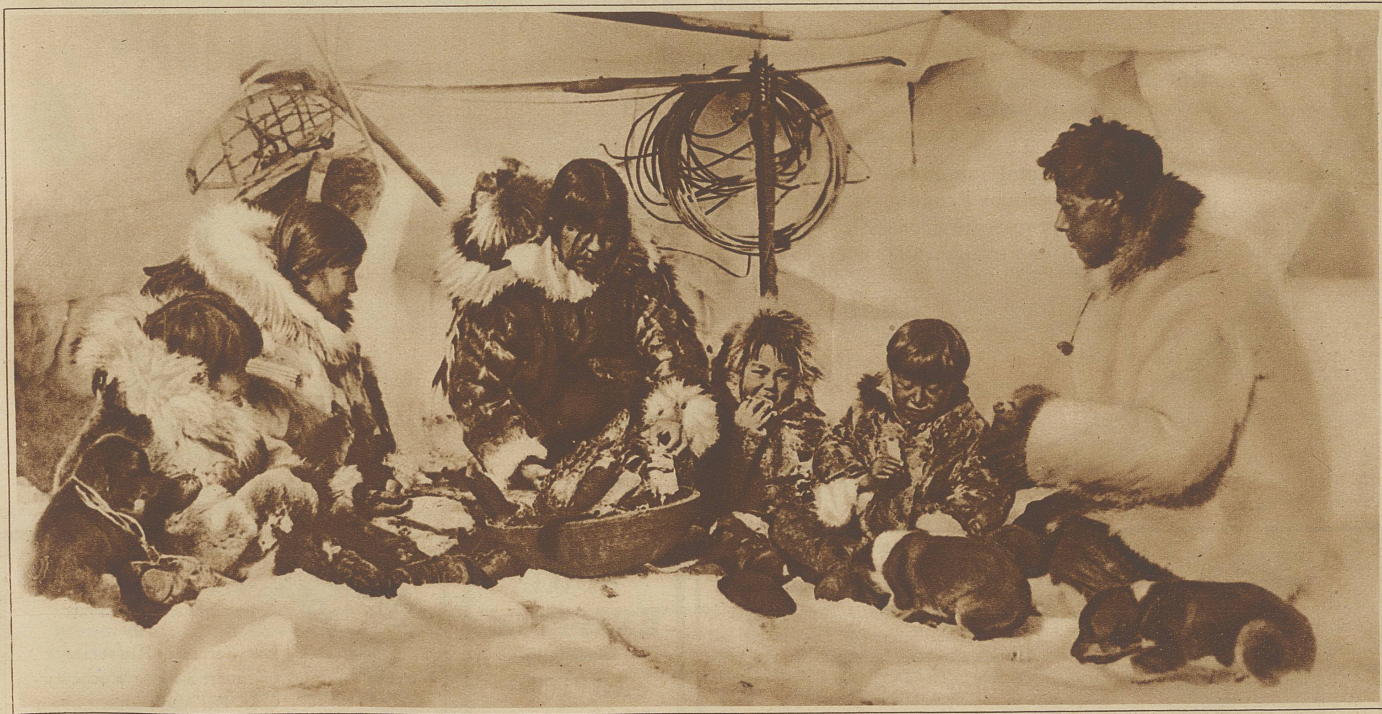
Eskimo-Familie in einer Eishütte in der Gegend der Berings-Straße bei ihrer einfachen Mahlzeit, die aus gefrorenem Fisch besteht. Solche Eishütten werden nicht als ständige Wohnstätte, sondern nur zum Uebernachten benützt

«Ich weiß», sagt er nach einem kurzen Schweigen und seine sanfte Stimme klingt auf einmal stark und