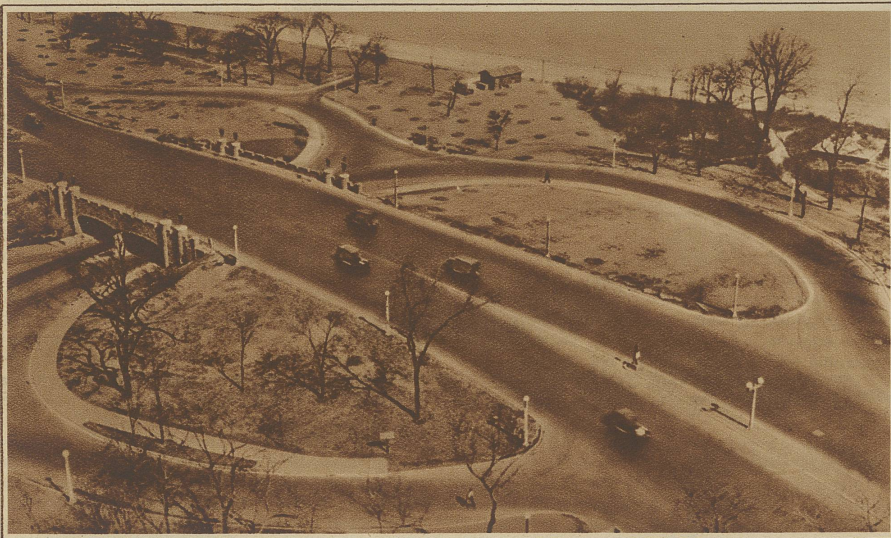
Die erste Schleifen-Autostraße wurde durch den Lincoln-Park in Chicago gebaut. Diese schleifenförmigen Ausweichstraßen erlauben das Abschwanken in eine Seitenstraße nach links, ohne daß die Fahrbahn entgegenkommender Wagen gekreuzt werden muß