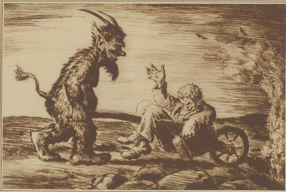
Radierung von Otto Quante