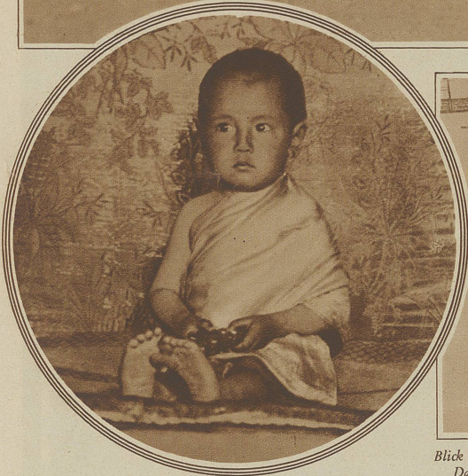
DER «HEILIGE LAMA»

im Tempel der Usersky-Dazan in der Mongolei. Dieses Kind wurde in der Todesstunde des Oberlamas geboren und nach der Sage ist daher die Seele des «großen, unsterblichen, weißen Lama» in seinen Leib übergegangen. Es wird als der menschgewordene Gott betrachtet und als solcher verehrt.