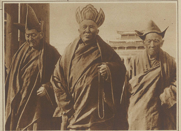
Das Oberhaupt des buddhistischen Lamaismus der Mongolei, Bandito-Kamba-Lama, der für den kaum zwei Jahre alten Heiligen Lama das Regiment führt

PUDOWKIN, der Schöpfer zahlreicher russischer Großfilme, hat kürzlich einen neuen Film, «Sturm über Asien», vollendet, der in einem