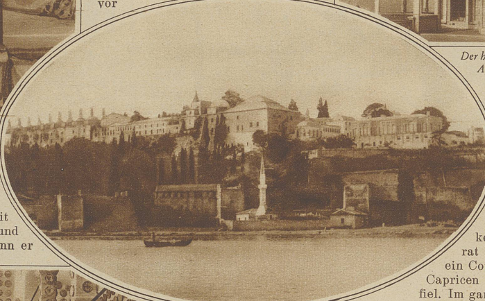
Blick vom Marmarameer auf den Serail. Links die Küchen des kaiserlichen Haushaltes

lata, das ebensogut Belgrad heißen könnte und auf das kleinasiatische Skutari, bietet sich dem Fremdling vom Serail aus bei Sonnenaufgang oder -untergang ein wahrhaft märchenhafter Anblick. Man sollte Konstantinopel und die ganze Umgebung nur vom Serail aus genießen, oder aber vom Schwarzen Meer durch den Bosphorus herkommend, ein paar Stunden vor