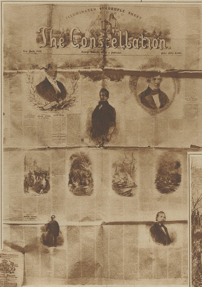
Holzschmitten in einer Zeitung New Yorks vom Jahre 1859. Man beachte das riesige Format des Blattes mit nicht weniger als 13 Spalten

Zeitungsfachmann wird seine Aufmerksamkeit in erster Linie der technischen Seite zuwenden und darüber hinaus gerne feststellen, welches die Stoffgebiete sind, die das Publikum zu allen Zeiten fesselten. Und er wird dabei nicht übersehen, daß zu allen Zeiten das Sensationelle im politischen, wirtschaftlichen und gesellschaftlichen Leben einem Großteil der Leserschaft erst durch das Bild wirklich nahegebracht wurde. Für viele haben allerdings diese alten Illustrationen nur Kuriositätswert, während der Kulturhistoriker in ihnen die reichste Fülle der Aufklärung findet. Kaum sonstwo hat er z. B. so schöne Gelegenheit, die wechselnde Mode zu studieren, ihre Launen zu erraten und den Zusammenhang mit dem Zeitempfinden zu spüren. Aber auch der Techniker wird mit Gewinn zu diesen vergilbten Blättern greifen, geben sie ihm doch Aufschluß über die verschiedenen Vorstufen, die den Weg zum heutigen Stand seines Gebietes gebnet haben. Vor der Zeit der Photographie war die Zeitungsidee immer auf die Individualität des Zeichners angewiesen, und wenn es sich darum handelte, ein einmaliges Ereignis festzuhalten, ging es nie ohne Zugabe ab, die ganz auf Rechnung der Phantasie des Künstlers zu buchen sind. Und daher wird es auch begreiflich, daß die Illustrierten erst dann richtig aufkommen konnten, als durch die wirklichkeitsgetreue Wiedergabe von Begebenheiten oder Situationen die größtmögliche Aktualität gesichert war.