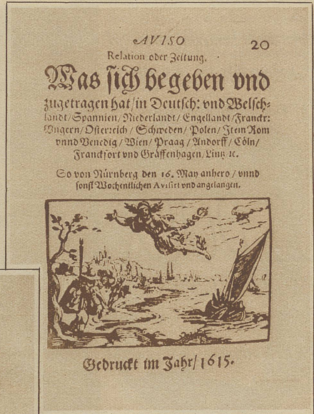
Zeitungskopf mit Illustration aus dem Jahre 1615

ersten Ausgaben kommt die Illustration vor. Die Entwicklung des Zeitungswesens war in hohem Maße abhängig von der Entfaltung der Postbeförderung und die Ausbildung des Bildtheiles von der technischen Vervollkommnung der Reproduktions-Verfahren. Wenn wir heute solche alten Ausgaben betrachten, dann können wir von verschiedensten Interessen erfüllt sein. Der