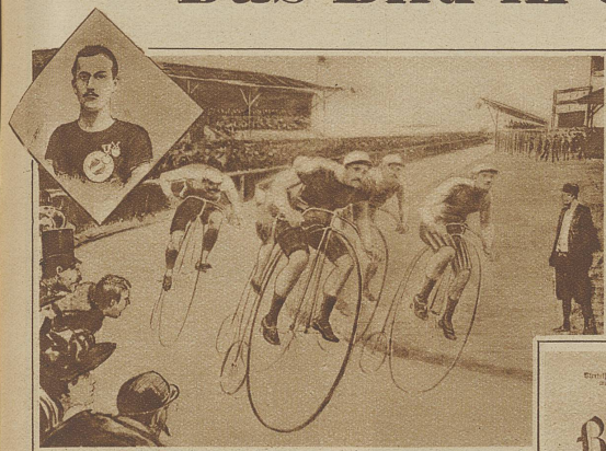
Zeitungsausschnitt mit einem Momentbild aus einem Radrennen in Halensee (1892). Die Reproduktion photographischer Aufnahmen bot zu dieser Zeit immer noch bedeutende Schwierigkeiten. Die Zeitungen zogen deshalb die Wiedergabe zeichnerischer Illustrationen vor

fehlte ihnen die spezifische Form, die im periodischen Erscheinen der Zeitung vorhanden ist. Als wichtigsten Vorläufer der Zeitung hat man die in fast allen Sprachen erschienene Veröffentlichung jenes Briefes anzusehen, den Kolumbus an den königlichen Schatzmeister Rafael Sanchez schrieb. Das war im Jahre 1493. Die ersten eigentlichen Zeitungen kann man zurückverfolgen bis in die ersten Jahre des 17. Jahrhunderts und schon in diesen