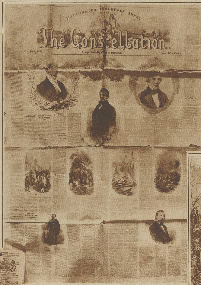
Holzschnitte in einer Zeitung New Yorks vom Jahre 1859. Man beachte das riesige Format des Blattes mit nicht weniger als 13 Spalten

rend der Kulturhistoriker in ihnen die reichste Fülle der Aufklärung findet. Kaum sonstwo hat er z. B. so schöne Gelegenheit, die wechselnde Mode zu studieren, ihre Launen zu erraten und den Zusammenhang mit dem Zeitempfinden zu spüren. Aber auch der Techniker wird mit Gewinn zu diesen vergilbten Blättern greifen, geben sie ihm doch Aufschluß über die verschiedenen Vorstufen, die den Weg zum heutigen Stand seines Gebietes geebnet haben. Vor der Zeit der Photographie war die Zeitungssillustration immer auf die Individualität des Zeichners angewiesen, und wenn es sich darum handelte, ein einmaliges Ereignis festzuhalten, ging es nie ohne Zugaben ab, die ganz auf Rechnung der Phantasie des Künstlers zu buchen sind. Und daher wird es auch begreiflich, daß die Illustrierten erst dann richtig aufkommen konnten, als durch die wirklichkeitsgetreue Wiedergabe von Begebenheiten oder Situationen die größtmögliche Aktualität gesichert war.