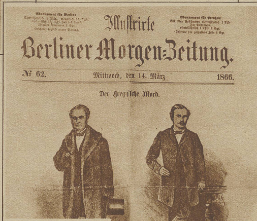
Illustrationen zu einem Mordprozeß auf der ersten Seite einer Tageszeitung (1866)

Während die eigentlichen illustrierten Zeitungen im deutschen Sprachgebiet erst um die Mitte des vorigen Jahrhunderts aufkamen, so fehlten doch schon in den viel ältern Zeitungen nicht bildliche Darstellungen, deren propagandistischen oder instruktiven Wert man früh erkannt hatte. Aber auch die Zeitung war nicht die Schöpfung eines Augenblickes, sondern sie erwuchs aus verschiedenen Vorläufern, die inhaltlich die gleiche