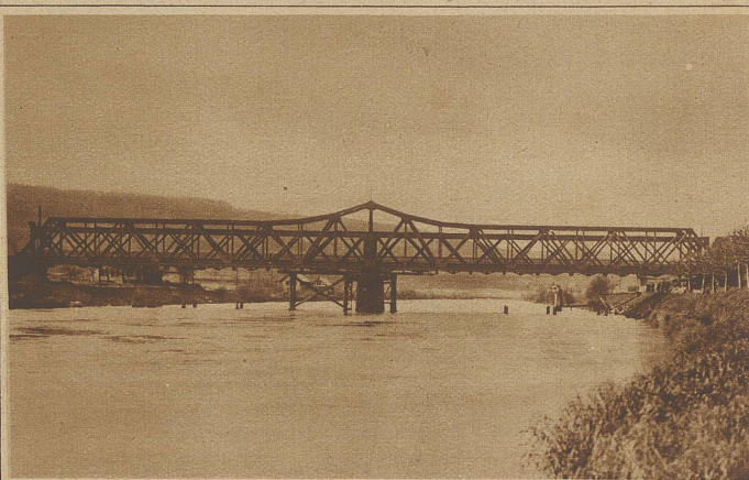
Die beiden Brücken nach der Auswechslung