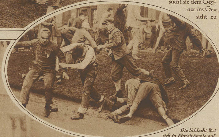
Die Schlacht löst sich in Einzelkämpfe auf

der Fabrikation, sondern auch eine alte Universitätsstadt, deren Gründung schon in der Mitte des 15. Jahrhunderts erfolgte. Das heutige Universitätsgebäude, das alljährlich den Hintergrund für einen seltsamen Kampf bildet, der mit eigenartigen Waffen von den Studenten ausgetragen wird, ist allerdings erst in der zweiten Hälfte des vergangenen Jahrhunderts erstellt worden und zieht sich in seiner, in altgotischem Stil gehaltenen Fassade, in einer Länge von 162 Metern hin und wird durch einen 91 Meter hohen Turm dominiert. + Es ist ein wenig erbaulicher