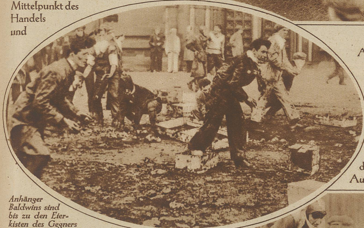
Anhänger Baldwins sind bis zu den Eierkisten des Gegners vorgedrungen

Aufmarsch, in dem die Studenten stets am Tage der Rektoratswahl aufbrücken, aber gehört nun einmal in das Bild des studentischen Lebens, an das sich die ganze Einwohnerschaft schon längst gewöhnt hat. Bei der letzten Wahl galt es Sir Austen Chamberlain zu er-