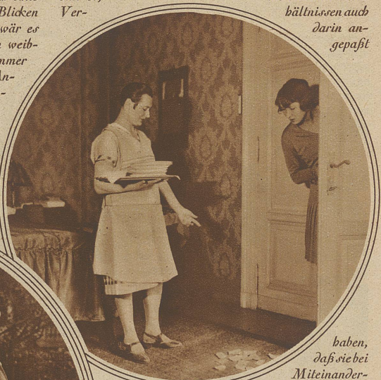
haben, daß sie bei Miteinanderarbeit in Geschäfts- und Erwerbsleben, bei Vorgesetzte- und Untergeordnetsein alles Subjektive ausschalten? Daß sie von der zufällig sich ergebenden Konstellation in der Stellung zu einander alles Persönliche ausschalten und nur die positive Leistung, nur wirkliches Können gelten lassen. Warum fällt es der Frau so entsetzlich schwer, eine Rüge aus dazu berechtigtem Frauenmunde schweigend hinzunehmen. Hei, wie das in solchen Fällen rebelliert und gleich tausendundein Dinge — wenn vielleicht auch nur in Gedanken — hervorkramt, die die andere auch nicht richtig macht. Müßte es von

Wie schwer aber machen es sich die Frauen oft erst, wenn sie im Existenzkampf in Konkurrenz treten. Wieviele sind es, die sich den neuen Verhältnissen auch darin angepaßt