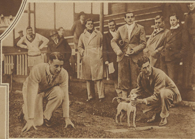
Der Hund ist schneller. Start zu einem Wettlauf zwischen Hund und Mensch. Der Hund blieb Sieger

die bekannte schwedische Schriftstellerin, feiert am Dienstag ihren 70. Geburtstag