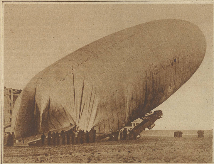
Eine mißglückte Landung. Das amerikanische Marineluftschiff «J. 3.» konnte bei seiner Rückkehr von einem Übungsflug nach Lakehurst nicht glatt landen und schlug mit voller Gewalt auf. Ein Teil des Gerüsts zerbrach und nur durch einen glücklichen Zufall wurde niemand verletzt