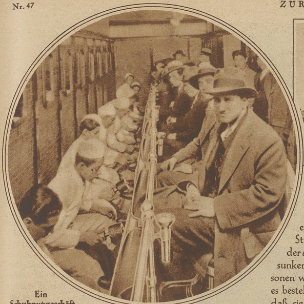
Ein Schuhputzgeschäft für Massenkundschaft

ist in New York eröffnet worden. In langen Reihen sind die elektrisch getriebenen Apparate angebracht, die so schnell und exakt arbeiten, daß die Kunden auch bei stärkstem Andrang kaum 2 Minuten warten müssen