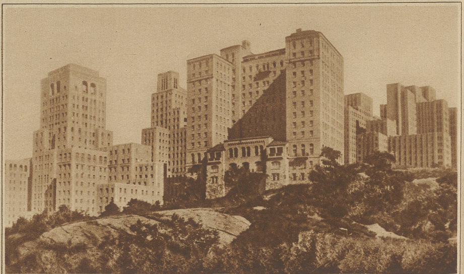
Eine Krankenstadt in New York. In einem Außenquartier New Yorks ist ein Wolkenkratzerkomplex entstanden, der ausschließlich Krankenhäuser, Erholungsheime und Arztwohnungen enthält