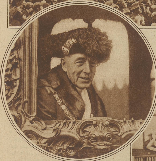
Lord Mayor, Sir Kynaston Studd, in der Staatskutsche