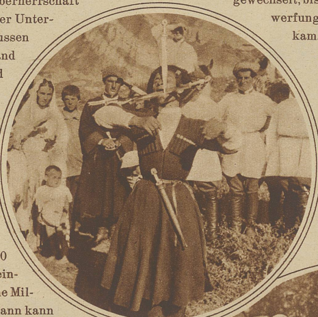
Links: Der berühmte kaukasische Messertanz. Ein Daghestaner tanzt die Lesgin-ka mit sechs scharfen Kinschalen (Dolchen)

wie gewaltig auch die klimatischen Unterschiede sein müssen und die dadurch bedingte verschiedene Beschäftigungsweise. In dem öden und nur wenig fruchtbaren Bergland, wo all die kleinen Ortschaften in strategisch gut gesicherten Gegenden liegen, ernähren sich die Bewohner aus spärlicher Schafzucht, während in den meerwärts gelegenen Gebieten das Klima so milde ist, daß sogar die edelsten Früchte gedeihen und neben Getreide auch Obst, Wein und Tabak gepflanzt und Ackerbau getrieben wird. Immerhin führt auch heute noch ein großer Teil der Bevölkerung ein Nomadenleben. + In ihrer Architektur scheinen die