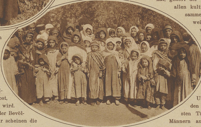
Eine interessante Gruppe von Frauen und Mädchen aus dem Aul Kuja in den daghestanischen Bergen. Viele von ihnen tragen auf der Stirn eine doppelte Kette, die ganz aus massivem Silber besteht