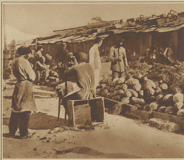
Vor dem Bahnhof in Machatsch-Kala steht Bude an Bude mit Wassermelonen-Verkäufern