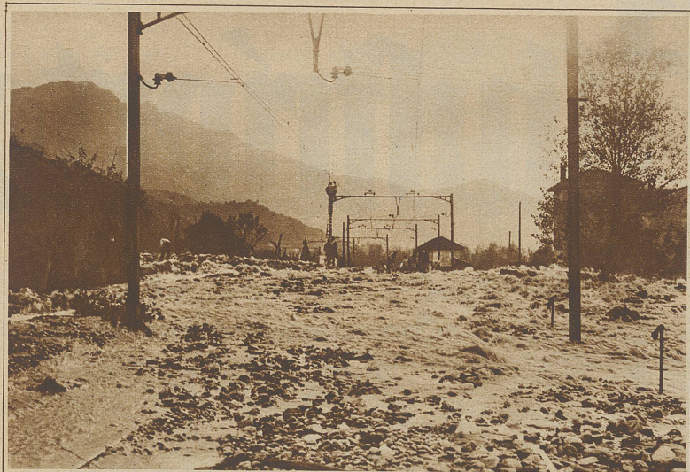
Der überschwemmte Bahnkörper der Gotthardbahn bei Arbedo