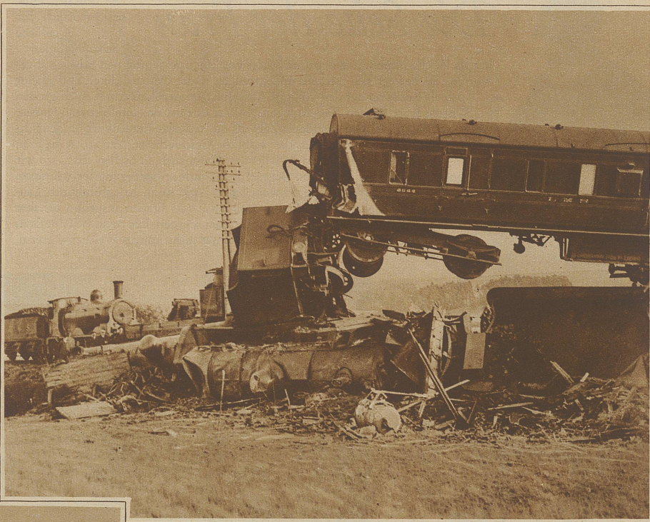
Ein Personenwagen wurde auf die beiden gestürzten Lokomotiven hinaufgeschoben

russischen Zarenhof, tritt in Dresden als Sängerin auf