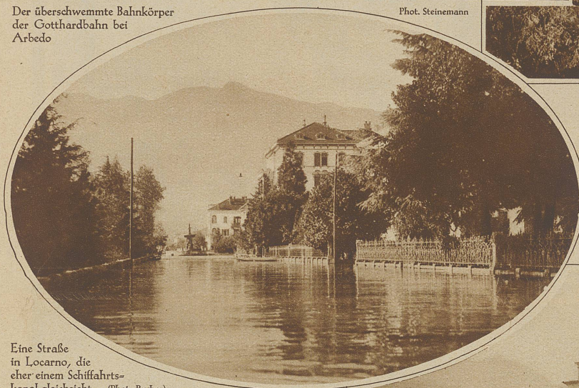
Eine Straße in Locarno, die eher einem Schiffahrtskanal gleicht