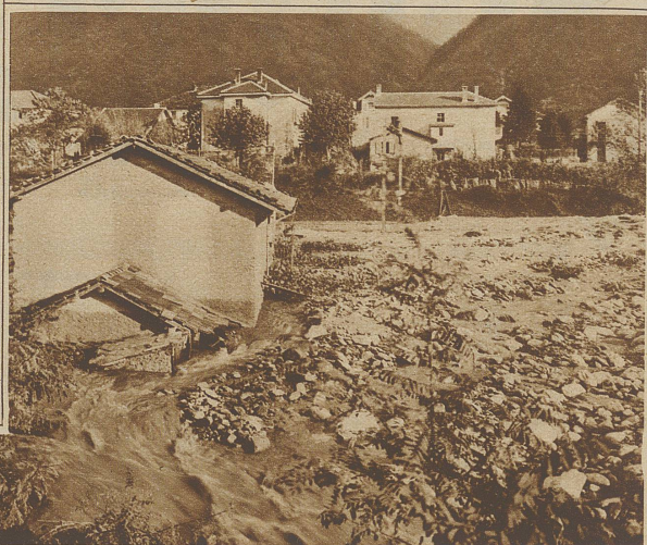
Ein von den Fluten bedrohtes Haus, das schon bis zu halber Höhe im Geschiebe steht