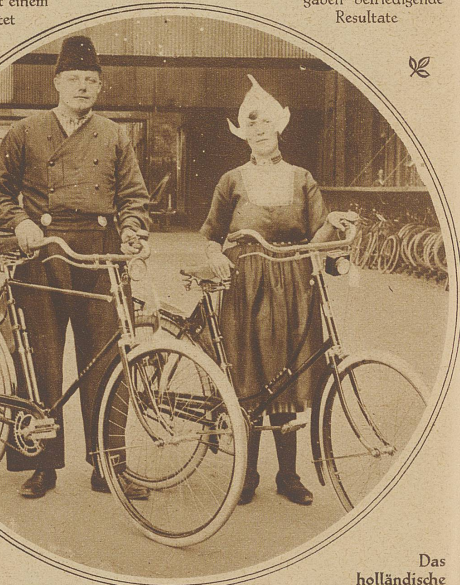
Das holländische Ehepaar Heesters aus Volendam, das zu Rad auf einer Europareise begriffen ist, die im ganzen zwei Jahre dauern wird, machte uns auf der Redaktion seine Aufwartung