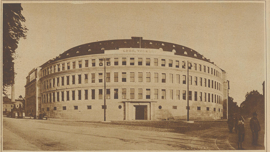
Das neubaute große Geschäftshaus der Firma Gebrüder Volkart in Winterthur.