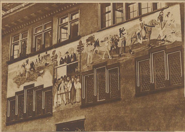
Das aus der zweiten Hälfte des XVI. Jahrhunderts stammende Rathaus in Appenzell ist restauriert und mit Malereien versehen worden. Die drei Bilder stellen eine Landsgemeinde und den Auszug und die siegreiche Rückkehr von der Schlacht am Stoß dar.