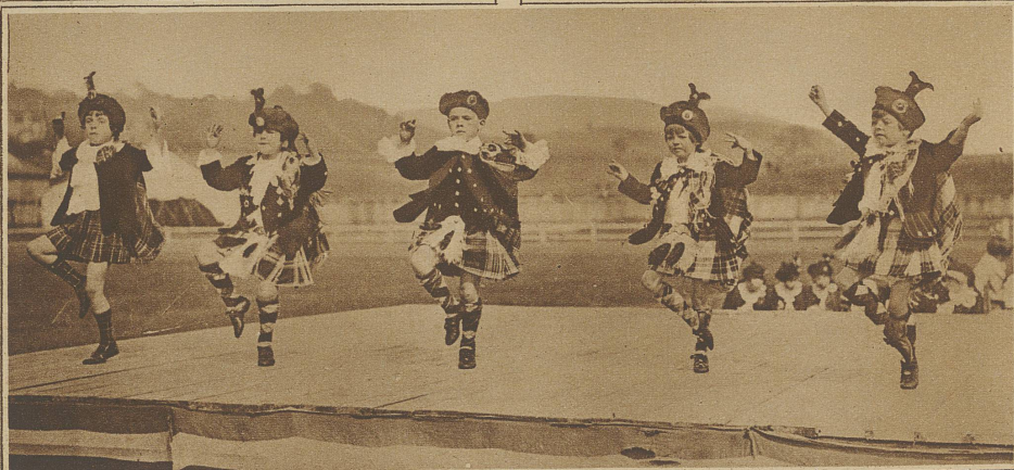
Kleine Schottländer führen einen Nationaltanz vor, der sehr gut als gymnastische Übung gelten könnte, wenn die Kinder anstatt der zwar malerischen, aber etwas schwerfälligen Hochländertracht, mit dem Turnhemd bekleidet wären

eine andere Logik, sie ist logisch auf ihre Art. Nur ist ihre Logik zuweilen mehr Folge ihrer Laune und geistigen Sprunghaftigkeit, als Folge des Nachdenkens oder einer wirklichen Meinung. *