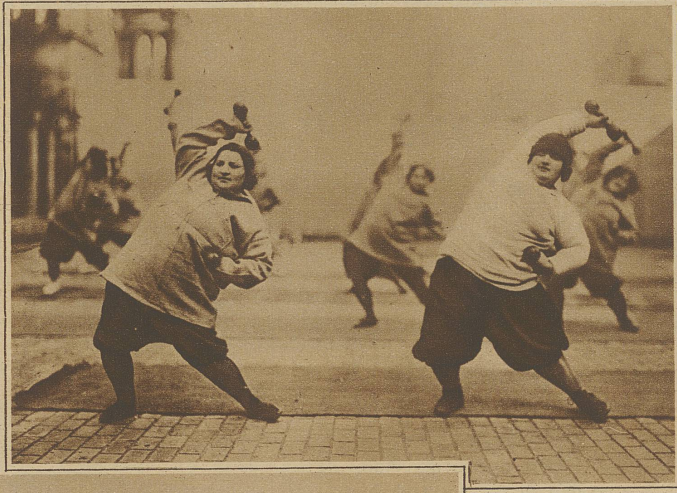
Auch diese weibl. «Frachtkolli» möchten schlanker und wieder etwas beweglicher werden

Man wirft der Frau häufig vor, sie sei unlogisch. Die Frau hat nur