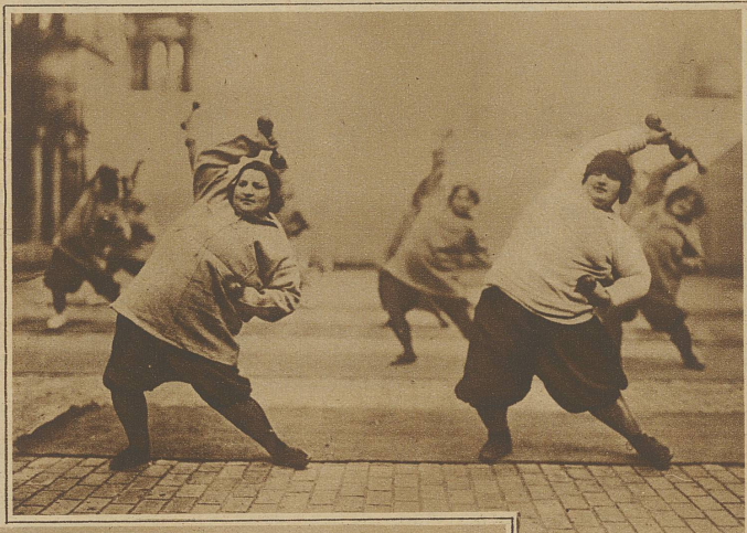
Auch diese weibl. «Frachtkolli» möchten schlanker und wieder etwas beweglicher werden

Man wirft der Frau häufig vor, sie sei unlogisch. Die Frau hat nur