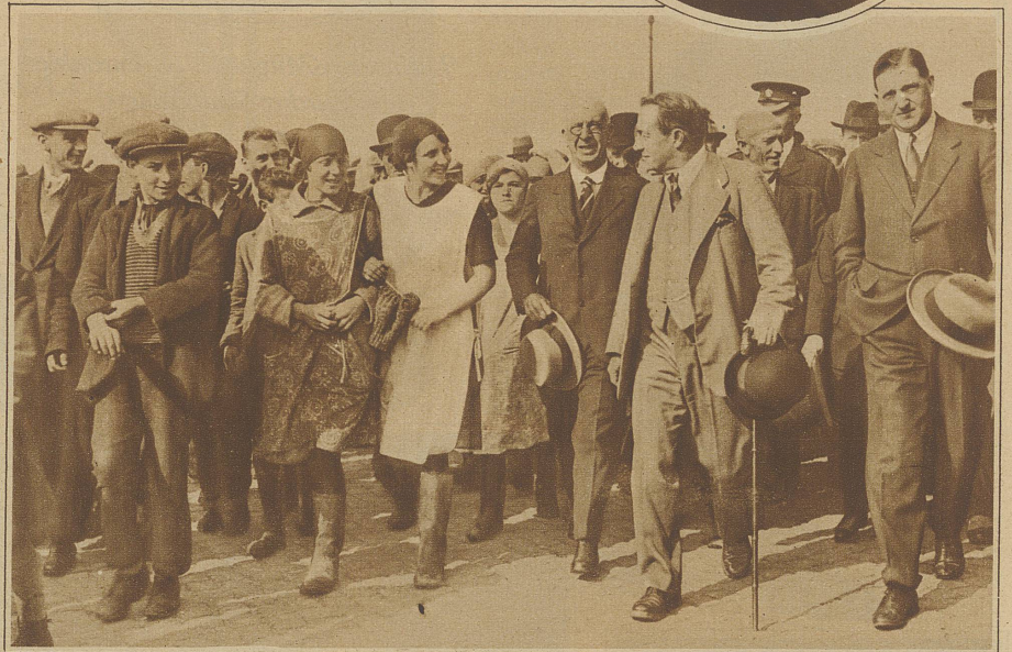
Der Diplomat auf Urlaub. Baldwin schäkert in Yarmouth mit schottischen Fischermädchen