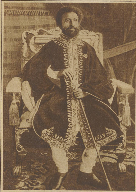
Auch Ras Tafari, der bevollmächtigte Regent von Aethiopien, lässt sich zum König krönen