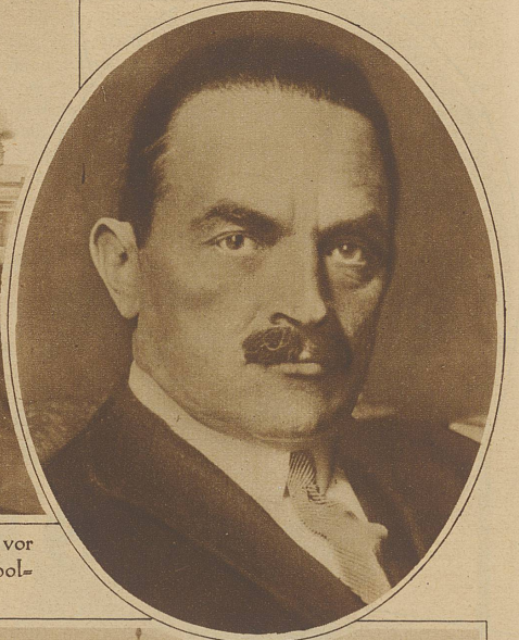
Bild im Oval: Der polnische General Zagorski, der vor einiger Zeit spurlos verschwunden ist, soll von hohen polnischen Offizieren erschossen worden sein

Der neue Zeppelin flog anlässlich des 34-stündigen Distanzfluges auch über Berlin. Das Bild zeigt ihn über dem Brandenburger Tor