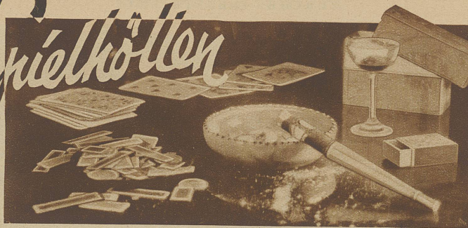
Stilleben auf dem Spieltisch

Man nennt sie Spielhöllen, jene verschwenderisch reichen Säle mit den grünen Tischen, den weichen Polstertühlen, den bemalten Wänden und Decken, den Marmorsäulen und den prunkvollen Leuchtern. Jene Säle, in denen kein Laut so oft erklingt als die monoton gesprochenen Sätzchen: «Faites vos jeux, Messieurs» — «Rien ne va plus!» Und dazwischen liegt das Glück, liegt der Reichtum, liegt aber auch die Not, der Tod. Doch niemand hat die Psychologie des Spielers geschrieben, wenn auch Bücher von dem Leben der Spieler berichten. Dostojewski, der zu Zeiten selbst