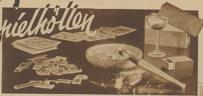
Stilleben auf dem Spieltisch

Man nennt sie Spielhöllen, jene verschwenderisch reichen Säle mit den grünen Tischen, den weichen Polsterstühlen, den bemalten Wänden und Decken, den Marmorsäulen und den prunkvollen Leuchtern. Jene Säle, in denen kein Laut so oft erklingt als die monoton gesprochenen Sätzchen: «Faites vos jeux, Messieurs» — «Rien ne va plus!» Und dazwischen liegt das Glück, liegt der Reichtum, liegt aber auch die Not, der Tod. Doch niemand hat die Psychologie des Spielers geschrieben, wenn auch Bücher von dem Leben der Spieler berichten. Dostojewski, der zu Zeiten selbst