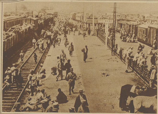
Die Japaner in China