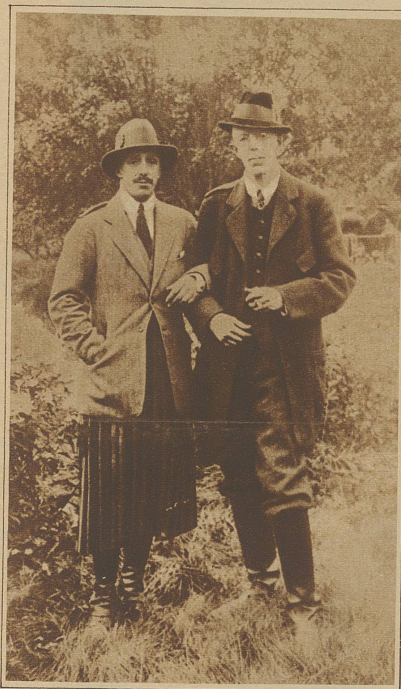
Der König von Spanien als Jagdgast des Königs von Schweden

Linienetz ständig weiter ausdehnte und Wagen geschaffen hat, die vermöge ihrer innern Ausstattung und der bequemen Bauart mit weitausladenden Aussichts-fenstern in jeder Beziehung der Fahrt im Eisenbahnwagen vorzuziehen sind. Die Kabinen können für die Nacht in Schlafkabinen verwandelt werden