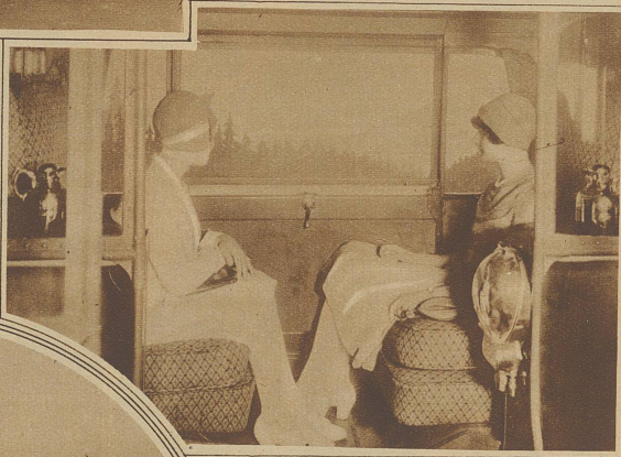
Eine Kabine im Innern des Omnibusses