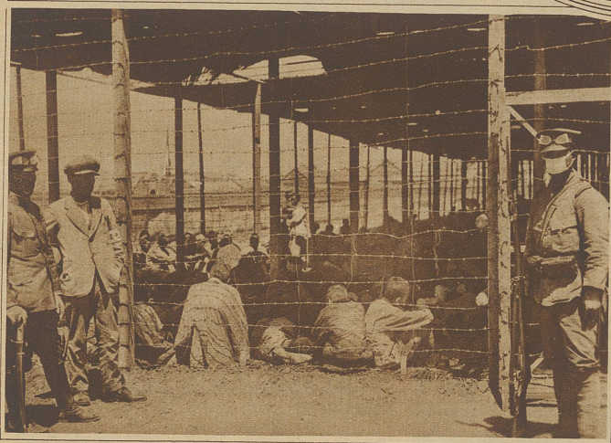
Chinesische Gefangene in einem von Japanern bewachten Stacheldrahtkäfig

Dem Konstrukteur de la Cierva ist letzte Woche der erste größere Distanzflug gelungen. Er flog mit seinem «Autogiro» – wie er das tragflächenlose, nur durch Hubpropeller getragene Flugzeug nennt – von London nach Paris. Als er dann den französischen Behörden die Vorzüge seiner Konstruktion (senkrechter Aufstieg und ebensolche Landung) demonstrieren wollte, stürzte der Apparat aus geringer Höhe plötzlich ab und ging in Trümmer. Der Erfinder selbst blieb heil