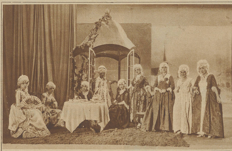
Zürcher Biedermeiergruppe, die letzten Samstag anlässlich ihrer Vorführung im Kongressaal großen Beifall fand