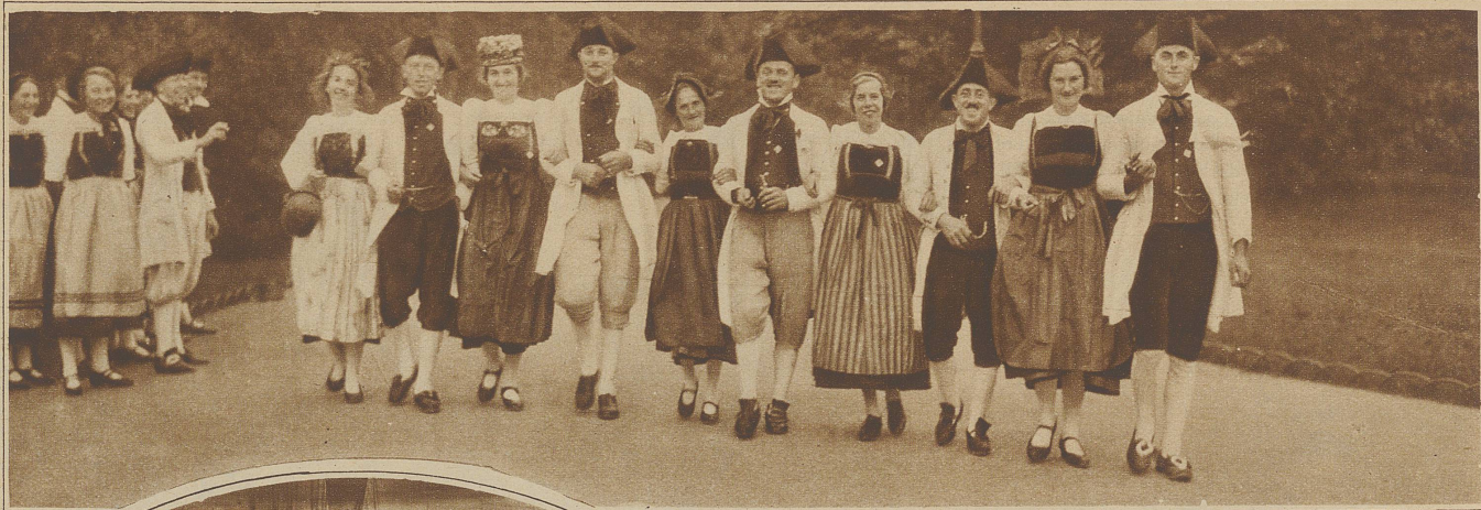
Fröhliche Zürchergruppe, eine Wehn- taler Bauernhochzeit vor 150 Jahren darstellend