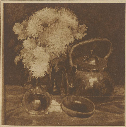
Stilleben mit Astern

darauf ankommen, Erreichtes zu vertiefen. Und hier mußte nun neben der unermüdlichen Vollkommenheit der malerischen und zeichnerischen Technik die menschliche Reife ein wichtiges Wort mitsprechen. So kommt es, daß der Künstlerin jede Pose fremd ist – es sei denn, daß sie für das Modell Wesenselement ist –, daß sie bei einem Porträt nicht das zufällig Einmalige interessiert, sondern das, was letzten Endes