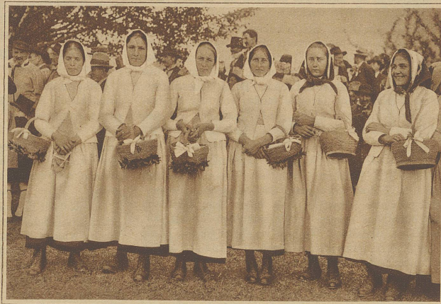
Frauen aus Salvan in ihren einfachen aber deshalb nicht minder schönen Trachten