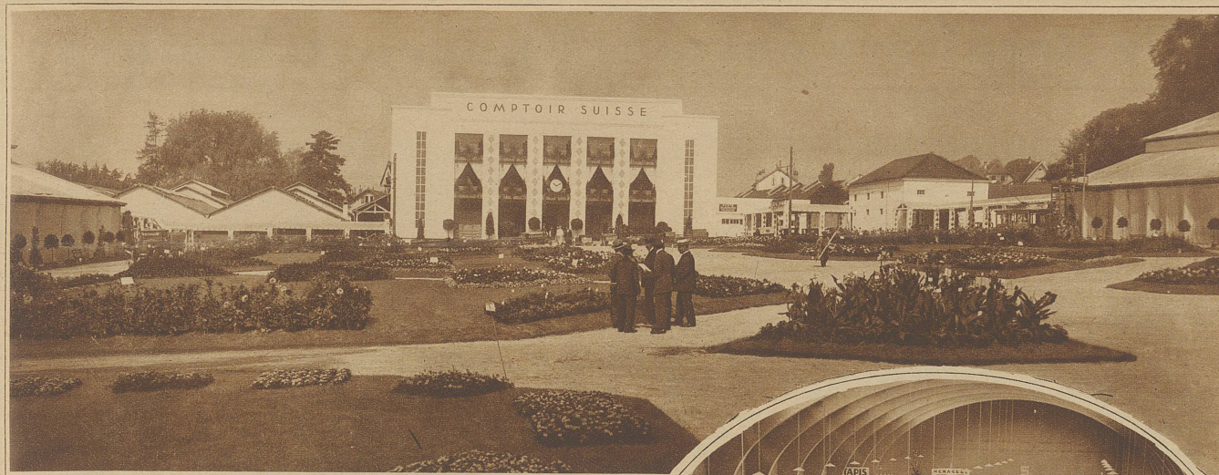
Blick auf die Messegebäude vom Haupteingang aus