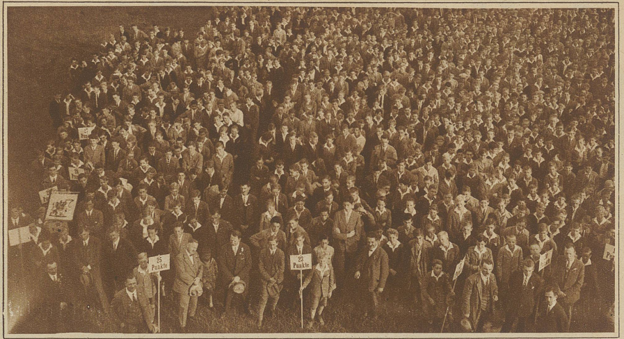
Die Preisträger des Knabenschiessens warten auf ihre Gaben