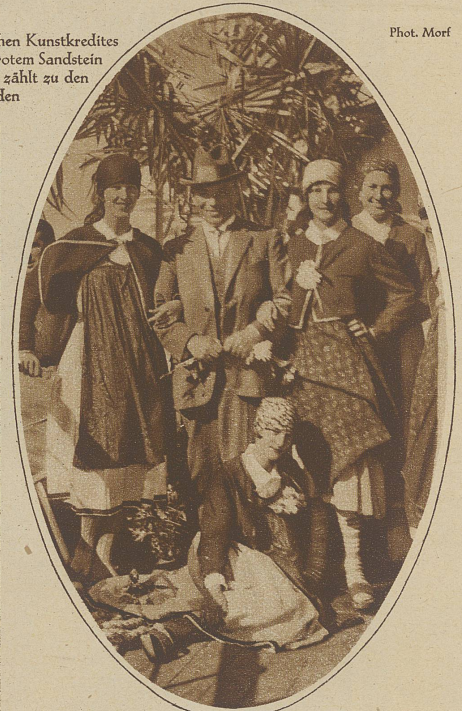
Bundesrat Musy amüsiert sich nach seinem Vortrag über die eidgenössischen Finanzen im Kreise fröhlicher Tessinerinnen