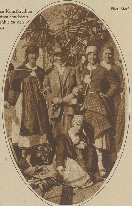
Bundesrat Musy amüsiert sich nach seinem Vortrag über die eidgenössischen Finanzen im Kreise fröhlicher Tessinerinnen