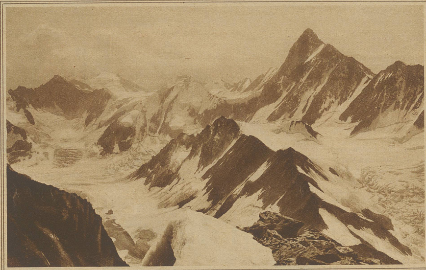
Das Finsteraarhorn vom Grossen Schreckhorn aus gesehen

Philipp Galeen wollte ihnen aus dem Wege gehen. Aber es war schon zu spät. Sie hatten den Kollegen erkannt und ließen ihn nicht frei. Sie erzählten von dem Film, den sie hier aufnehmen wollten. Ein Kammerspiel! Ohne Prunk und große Aufmachung! Ein Ehespiel, dessen seelische Gelöstheiten hier ein tragisches Ende fanden, im wilden Sturm auf wildem Meer. Die Trägerin der Titelrolle hatte blondes Haar und eine zarte Gestalt. Sie erinnerte Philipp Galeen in den ersten Tagen an Sybill, aber bald erkannte er den Unterschied. «Sie ähneln sich,» dachte er, «wie eine bestaubte Asphaltblume einer Parkblume in einem verwunschenen Garten gleichen kann, in dem ein Springbrunnen rieselt und weiße Marmorgötter in der Sonne stehen und den ein Gitter trennt von den Wegen, auf denen andere Menschen gehen.»