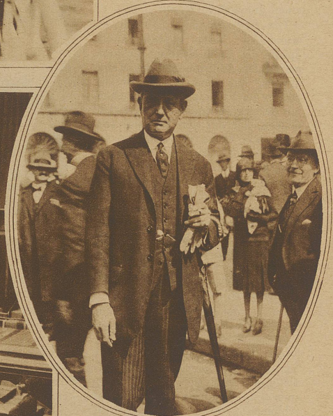
Zahle, Dänemark Präsident der diesjährigen Tagung