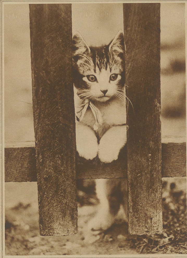
Was seht bei Nachbars vor?

Plötzlich durchströmte ihn heiß ein Entzücken. Sybills Hand legte sich im Dunkeln in die seine und er verstand, der Mann dort im Film, der spielte, ihr seine ganze Seele zu offenbaren, hatte ihre Scheu gelöst und ihr die Kraft gegeben, ihre Liebe zu erkennen.