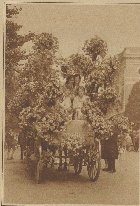
Mail coach in Rosen