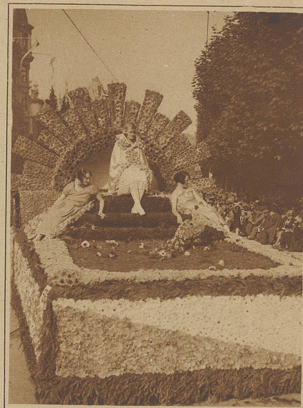
Nicht die gewählte, aber preisgekürnte Blumenkönigin