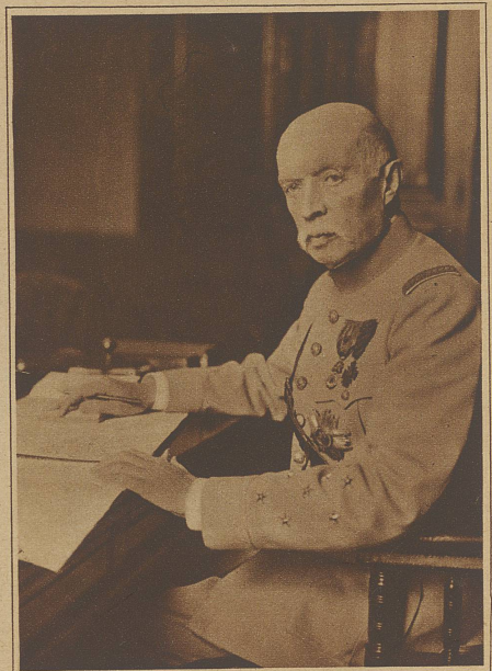
Marschall Fayolle, einer der bekanntesten französischen Heerführer im Weltkriege, ist im Alter von 76 Jahren gestorben