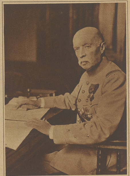
Marschall Fayolle, einer der bekanntesten franzö- sischen Heerführer im Weltkriege, ist im Alter von 76 Jahren gestorben