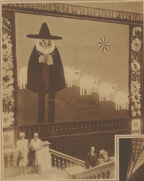
«Schafhirte», ein origineller Riesengobelin aus Wolle auf der Textilmesse