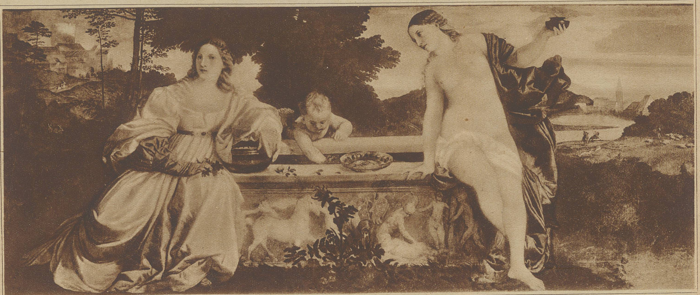
Tizian: Weltliche und geistliche Liebe

port in den Werken Tizians an. Feinnervig durchdringt Leonardo da Vinci das rätselhafte Wesen des Weibes. Er bringt zum erstenmal das eigene Schönheitsideal in die Kunst aus der eigenen Erkenntnis. Er umspannt alle Grade der Holdseligkeit bis zur Dämonie. Schönheit wird zur Pflicht, zum Strahl des Himmels. So entsteht eine Atmosphäre der Sinnlichkeit, welche die Grenzen zwischen Fürstin und Kurtisane verwischt, in der Tizian Gesetzgeber ist. Er malt das Weib als Königin rauschender Liebesfeste, ihre Schönheit in antiker Ruhe und Geschlossenheit, das Ideal der reifen Frau, die nach dem Kelter der Liebe verlangt. Noch ist Geist in diesen Formen.