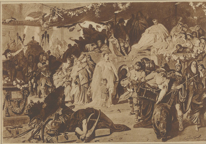
«Thusnelda im Triumphzuge des Germanicus» von C. von Piloty

port in den Werken Tizians an. Feinnervig durchdringt Leonardo da Vinci das rätselhafte Wesen des Weibes. Er bringt zum erstenmal das eigene Schönheitsideal in die Kunst aus der eigenen Erkenntnis. Er umspannt alle Grade der Holdseligkeit bis zur Dämonie. Schönheit wird zur Pflicht, zum Strahl des Himmels. So entsteht eine Atmosphäre der Sinnlichkeit, welche die Grenzen zwischen Fürstin und Kurtisane verwischt, in der Tizian Gesetzgeber ist. Er malt das Weib als Königin rauschender Liebesfeste, ihre Schönheit in antiker Ruhe und Geschlossenheit, das Ideal der reifen Frau, die nach dem Kelter der Liebe verlangt. Noch ist Geist in diesen Formen.