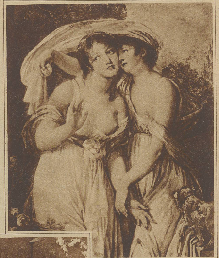
«Zwei Freundinnen» von Greuze

Rubens hat diesen ausgeschaltet. Er malt die Herrin der Sinne. Er wie Rembrandt schreiben im Banne ihrer Frauen, die jene Skala innerer Fülle des Empfindens nicht kennen und diese Ar-