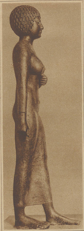
Statue der Takesut, Aegypten (2000 v. Ch.)

aus dem lebensdurstigen Italien nach dem Norden mitgebracht. Noch gleitet die Frau ohne Schwere über die Erde, noch ist sie mädchenhaft. Aber bereits seine Nachfolger kündigen durch schwellende Formen das Schönheitsideal des Cinquecento, verkör-